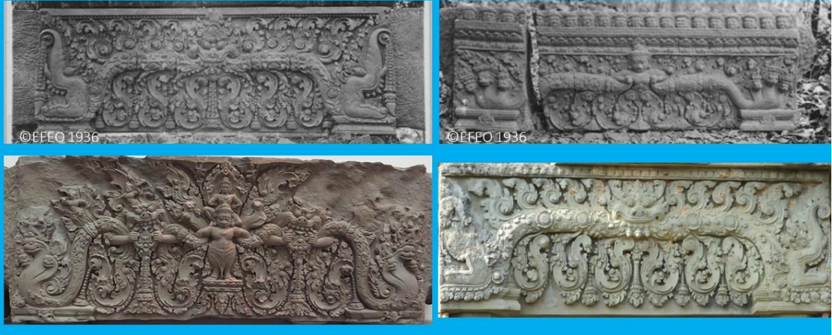
រូបលេខ៥៖ គំរូផ្តែរទ្វាររបេណាបថព្រះគោ (គ.ស.៨៧៥ - ៨៩៣)