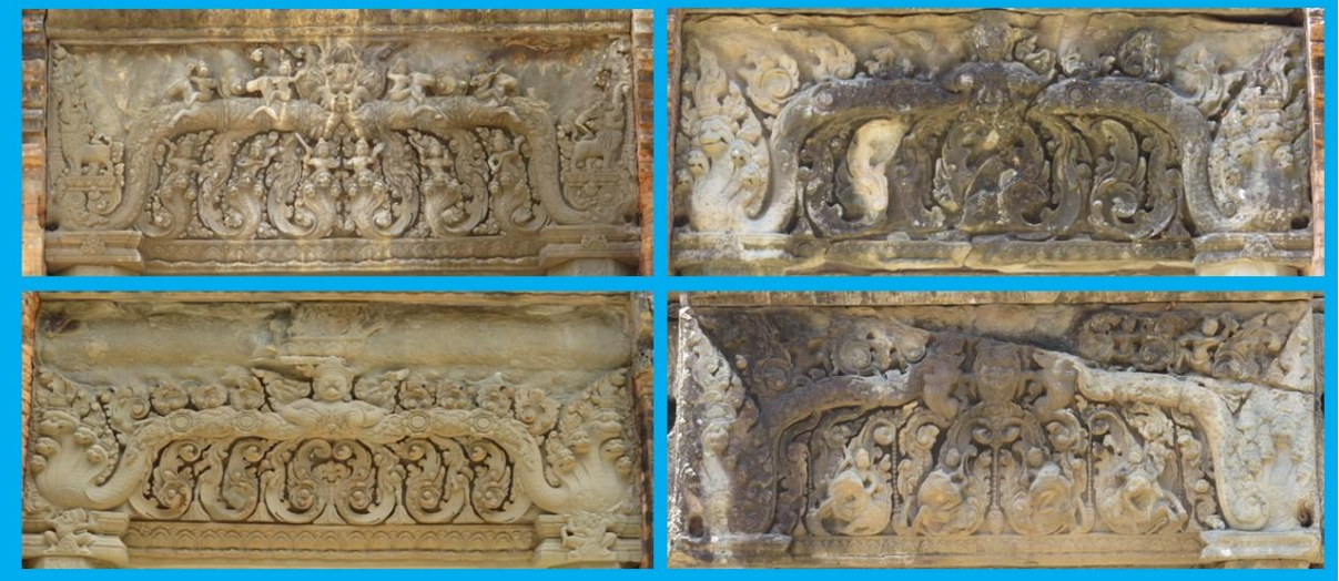
រូបលេខ៦៖ គំរូផ្តែរទ្វាររបេណាបថព្រះគោ (គ.ស.៨៧៥ - ៨៩៣)