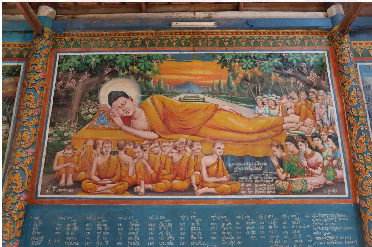
រូបលេខ៨ គំនូរក្នុងព្រះវិហារគូរត្រង់ "ទ្រង់បរិនិព្វាន"