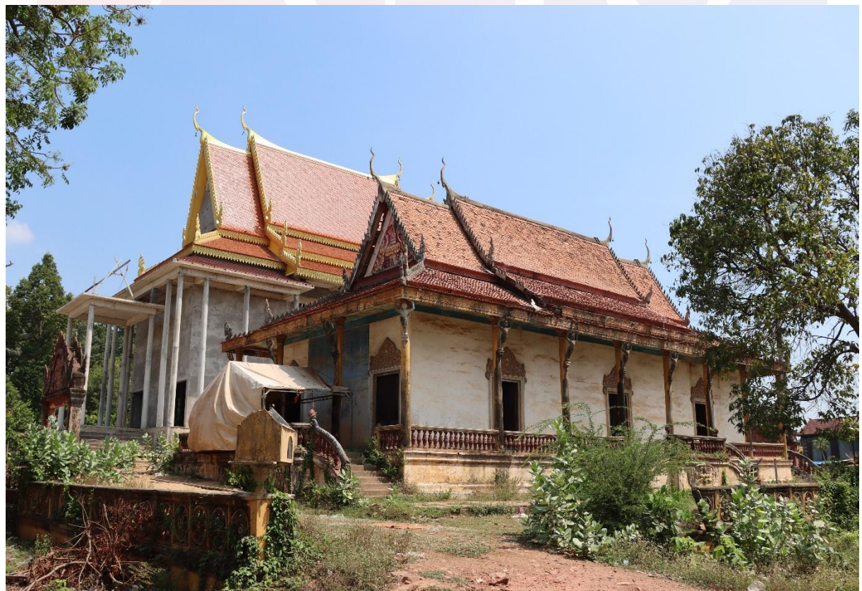
រូបលេខ១ ព្រះវិហារចាស់ និងព្រះវិហារថ្មីស្ថិតក្នុងវត្តរកាអារ

នៅតាមដងទន្លេមេគង្គក្នុងប្រទេសកម្ពុជា គេឃើញមានវត្តអារាមព្រះពុទ្ធសាសនា ជាច្រើនបានកសាងឡើងប្រកបដោយក្បាច់រចនា និងការតុបតែងយ៉ាងល្អវិចិត្រ សម្បូរ បែបទៅតាមតំបន់ និងសម័យនិយម។ ក្នុងបណ្តាវត្តដ៏ច្រើននោះ វត្តរកាអារក៏បានកសាង ឡើងប្របដងទន្លេមេគង្គដែរ ស្ថិតនៅត្រើយខាងលិច ក្នុងភូមិសាស្ត្រភូមិរកាអារ ឃុំរកាអារ ស្រុកកងមាស ខេត្តកំពង់ចាម។ វត្តនេះមានព្រះវិហារចាស់បាក់បែកមួយដែលធ្លុះធ្លាយ ដំបូល ប្រេះជញ្ជាំង បាក់ខ្លោង ស្រុតគ្រឹះ និងរលុបគំនូរជាដើម។ ចាប់ពីអំឡុងឆ្នាំ២០១៩ មកដល់បច្ចុប្បន្ន ព្រះសង្ឃនិងពុទ្ធបរិស័យចំណុះជើងវត្តរកាអារ បានកសាងព្រះវិហារថ្មី មួយទៀតនៅជាប់នឹងខ្លោងព្រះវិហារចាស់ (រូបលេខ១)។ ប៉ុន្តែទោះយ៉ាងណាក្តីតាមរយៈ សំណើរកត់ត្រាខ្លះៗលើជញ្ជាំងព្រះវិហារ និងស្លាកស្នាមសិល្បៈស្ថាបត្យកម្ម ព្រមទាំង គំនូរក្នុងព្រះវិហារក្នុងព្រះវិហារចាស់ គេអាចស្រមៃទិដ្ឋភាពសង្គមព្រះពុទ្ធសាសនា និង ការជ្រោមជ្រែងវត្តអារាមនៃសម័យកសាងព្រះវិហារនេះបានមួយអង្វើ។