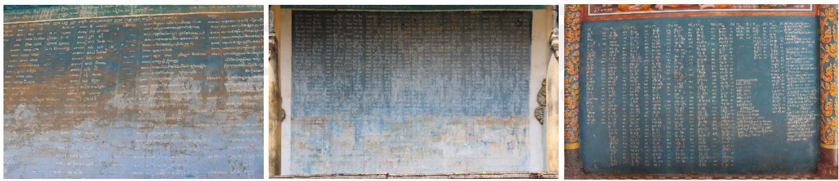
រូបលេខ១១-១៣ ចំណារកត់ត្រាសទ្ធាពុទ្ធបរិស័ទជិតឆ្ងាយចូលកសាងព្រះវិហារចាស់វត្តរកាអារ

ដោយឡែក បើសាកល្បងពិនិត្យចំណារផ្សេងៗទៀតនៅលើជញ្ជាំងព្រះវិហារនេះ ជាពិសេសគឺការកត់ត្រានាមពុទ្ធបរិស័ទ ដែលកើតសទ្ធាជ្រះថ្លាចំណាយប្រាក់ និងធនធានសាងព្រះវិហារខាងលើ គេមើលឃើញមានទាំងពុទ្ធបរិស័ទតាមវេនចំណុះជើងវត្ត ពុទ្ធបរិស័ទក្រៅប្រទេសផង និងសូម្បីតែកងកម្លាំងរបស់អង្គការសហប្រជាជាតិក៏បានចូលជាចំណែកកសាងជួសជុលព្រះវិហារនេះផងដែរ។ ទន្ទឹមនឹងនោះ គេឃើញមានប្រាក់ និងសម្ភារៈ (ដែក ស៊ីម៉ង់ត៍ ខ្សាច់...)មួយចំនួនទៀត បានពីការចូលរួមជ្រោមជ្រែងមកវត្ត និងបានពីការរៃអង្គាសទីជិតឆ្ងាយដូចជា វត្តមៀន(អូររាំងខ្ចី), ទួលគោក, ដេអិន, ផ្សារថ្មី(ភ្នំពេញ), ស្រែអំបិល(កោះកុង), អន្លង់គគីរ, វត្តវិហារសំណារ, វត្តព្រែកបង្កង, វត្តខ្ពស់លើ(ខេត្តកណ្តាល?), វត្តខ្នុរ(ព្រែកលាប), វត្តទូរី, វត្តស្វាយស្រណោះ(កំពង់ចាម) ។ល។