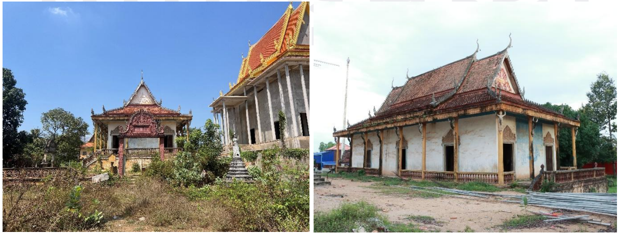
រូបលេខ២-៣ រចនាសម្ព័ន្ធព្រះវិហារចាស់វត្តរកាអារ

ព្រះវិហារចាស់ក្នុងវត្តរកាអារ គឺជាទម្រង់សំណង់ព្រះវិហារជហ្វា២ ដែលធ្លាប់បានជួសជុលកែលម្អរចនាសម្ព័ន្ធខ្លះកន្លងមក។ បច្ចុប្បន្នព្រះវិហារនេះមានដំបូលប្រក់ក្បឿងស្រកាលេញ ជាដំបូលក៏មានជម្រាលថ្នាក់ៗសងខាង។ នៅលើចុងព្រំដំបូលខាងមុខមានបំពាក់ជហ្វា២ និងជហ្វា២ទៀតនៅចុងព្រំដំបូលខាងក្រោយ ដែលជាចំណុចសម្គាល់ហៅព្រះវិហារជហ្វា២។ 1 ចំណែកនៅចុងចែងដំបូលនីមួយៗមានលម្អដោយនាគដងក្តារ (ឬនាគសន្លឹក) ជាប្រភេទសិល្បៈចម្លាក់ពុម្ពស៊ីម៉ង់ត៍។ រីឯនៅផ្នែកបាំងសាច់នៃព្រះវិហារមានសសររេតុដមូលចំនួន២០ដើម ដែលនៅតាមក្បាលសសរនីមួយៗលម្អដោយចម្លាក់គ្រុឌ និងកិន្ទរតាមសិល្បៈចម្លាក់ពុម្ពស៊ីម៉ង់ត៍ដែរ (រូបលេខ២-៣)។ ចំពោះហោជាងទាំងពីរនៃព្រះវិហារនេះ ជាសិល្បៈយ៉ាងសាមញ្ញធ្លាក់ក្បាច់រចនាពីកំបោរបាយអ ដែលខាងមុខមានរូបទេពប្រណាម និងខាងក្រោយមានរូបទៀនមួយដើមតម្កល់លើគម្ពីរត្រង់កណ្តាលសន្លឹកក្បាច់ (រូបលេខ៣-៥)។ សូមរំលឹកដែរថាបើយោងតាមចំណារលើជញ្ជាំងខាងក្រោយព្រះវិហារបញ្ជាក់ថា សសរបាំងសាច់ និងពិតានលើបាំងសាច់ ព្រមទាំងគំនូរលើពិតាននេះសាងឡើងក្នុងឆ្នាំ១៩៩២។ គំនូរលើពិតានបាំងសាច់នេះ គួរសាច់រឿងចម្រុះដូចជា រឿងព្រះមហាល័យ ព្រះឥន្ទ្រគូរទន្សាយក្នុងវង់ព្រះចន្ទ្រ និងសូម្បីពិធីដង្ហែកសាកបិលមហាព្រហ្មប្រទក្សិណតាមព្រេងនិទានទាក់ទងនឹងចូលឆ្នាំថ្មីក៏មានគួរបង្ហាញដែរ។ ប៉ុន្តែបើផ្អែកតាមចំណារលើជញ្ជាំងខាងលើ ក៏នាំឲ្យកាត់យល់បានថា ដើមឡើយសសរទាំងអស់នៅខាងក្រៅជញ្ជាំងព្រះវិហារគឺជាសសរឈើ ហើយលើបាំងសាច់ពុំទាន់មានពិតានឡើយ។