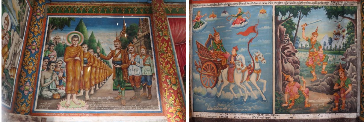
រូបលេខ៩-១០ គំនូរពុទ្ធប្រវត្តិ និងរឿងជាតកក្នុងព្រះវិហារចាស់វត្តរកាអារ

ដោយឡែក បើសាកល្បងពិនិត្យចំណារផ្សេងៗទៀតនៅលើជញ្ជាំងព្រះវិហារនេះ ជាពិសេសគឺការកត់ត្រានាមពុទ្ធបរិស័ទ ដែលកើតសទ្ធាជ្រះថ្លាចំណាយប្រាក់ និងធនធានសាងព្រះវិហារខាងលើ គេមើលឃើញមានទាំងពុទ្ធបរិស័ទតាមវេនចំណុះជើងវត្ត ពុទ្ធបរិស័ទក្រៅប្រទេសផង និងសូម្បីតែកងកម្លាំងរបស់អង្គការសហប្រជាជាតិក៏បានចូលជាចំណែកកសាងជួសជុលព្រះវិហារនេះផងដែរ។ ទន្ទឹមនឹងនោះ គេឃើញមានប្រាក់ និងសម្ភារៈ (ដែក ស៊ីម៉ង់ត៍ ខ្សាច់...)មួយចំនួនទៀត បានពីការចូលរួមជ្រោមជ្រែងមកវត្ត និងបានពីការរៃអង្គាសទីជិតឆ្ងាយដូចជា វត្តមៀន(អូររាំងខ្ចី), ទួលគោក, ដេអិន, ផ្សារថ្មី(ភ្នំពេញ), ស្រែអំបិល(កោះកុង), អន្លង់គគីរ, វត្តវិហារសំណារ, វត្តព្រែកបង្កង, វត្តខ្ពស់លើ(ខេត្តកណ្តាល?), វត្តខ្នុរ(ព្រែកលាប), វត្តទូរី, វត្តស្វាយស្រណោះ(កំពង់ចាម) ។ល។