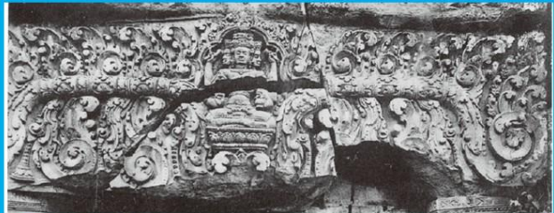
XXXIV A