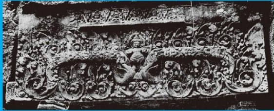
XXXVII B