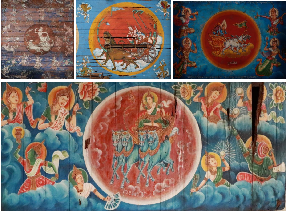
រូបលេខ៤-៧ គំនូរព្រះអាទិត្យ ឬព្រះសុរិយាទេវបុត្រគូរនៅតាមពិធានព្រះវិហារខ្លះ

ពាក់ព័ន្ធនឹងដំណើរនៃព្រះសុរិយាទេវបុត្រយាងចរចូលគោរិថី ក៏មានចែងនៅក្នុងសៀវភៅ “មហាសង្គ្រាន្ត” ផ្សាយជាប្រក្រតីប្រចាំឆ្នាំផងដែរ(រូបលេខ៨-១០)។ មហាសង្គ្រាន្តប្រចាំឆ្នាំនោះ តែងរៀបរាប់គណនាវេលាសង្គ្រាន្តឆ្នាំថ្មីចូលដល់ ព្រះនាមទេពធីតាដែលនឹងយាងមករក្សាលោក និងរណ្តាប់ផ្សេងៗត្រូវរៀបទទួលទេព្វាឆ្នាំថ្មីផង។ មិនតែប៉ុណ្ណោះនៅក្នុងសៀវភៅមហាសង្គ្រាន្តនោះសោតមានចែងទំនាយប្រចាំឆ្នាំ ជាទំនៀមដែលខ្មែរជឿពាក់ព័ន្ធនឹងទឹកភ្លៀង អាកាសធាតុ ផលដំណាំ និងជំងឺតម្កាត់ផ្សេងៗ ហាក់ពុំខុសពីអាថ៌សេចក្តីព្រះសម្មាសម្ពុទ្ធ ធ្វើយទៅនឹងបញ្ហាកម្មរបស់ព្រះបាទបស្មិន្ទិកោសលឡើយ។ ប៉ុន្តែសេចក្តីក្នុងសៀវភៅមហាសង្គ្រាន្តតាំងពីដើមមកដល់សព្វថ្ងៃ ពុំរៀបរាប់លក្ខណៈដំណើរព្រះសុរិយាទេវបុត្រក្នុងឥរិយាបថ ឬជិះលើអ្វីដូចសេចក្តីក្នុងអាទិសង្ឃមហាសង្គ្រាន្តទេ តែរៀបរាប់ដំណើរទេពធីតាដែលយាងចុះមក ទាំងលក្ខណៈតុបតែងព្រះកាយទេពធីតាអង្គនោះ រណ្តាប់ដង្ហាយជាគ្រូយាស្វាយ កេតនភណ្ឌ និងសត្វជាជំនិះ ។ល។