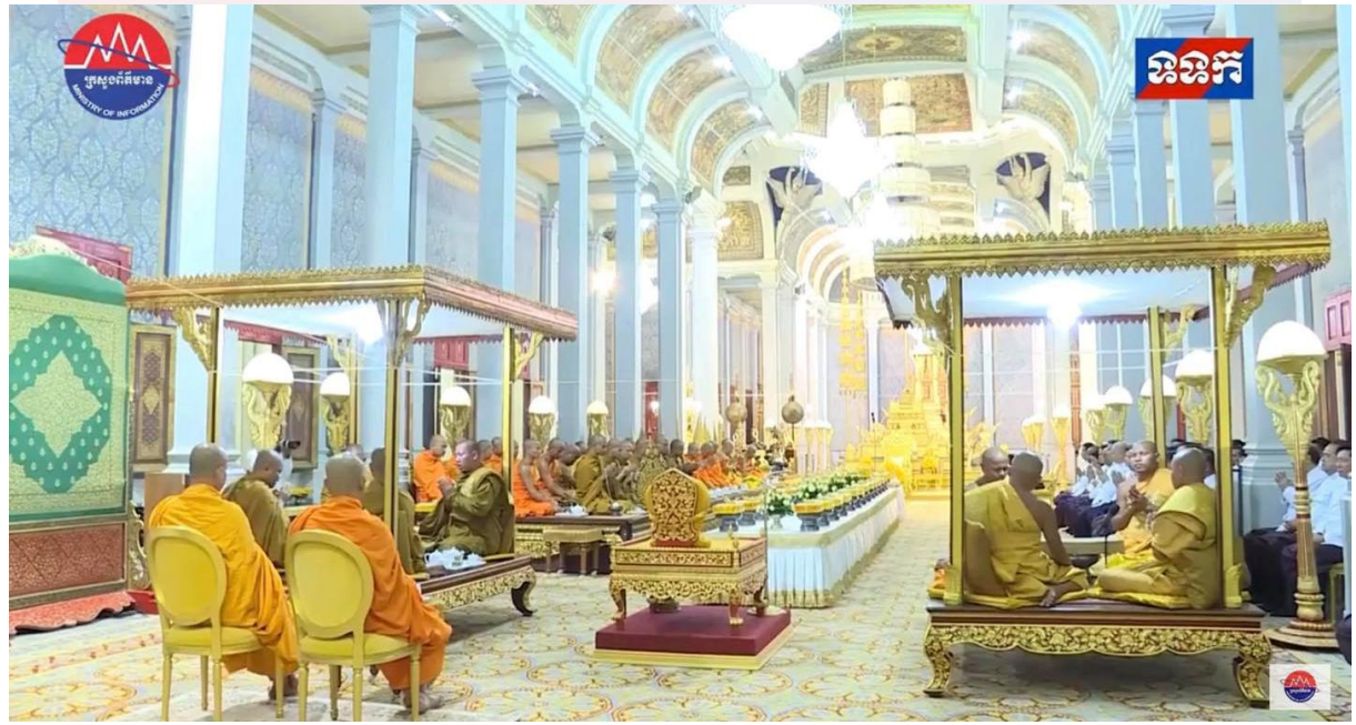
រូបលេខ៣ ព្រះរាជពិធីត្រស៊ូសង្គ្រាន្តក្នុងព្រះបរមរាជវាំង

ជាការពិត “សង្គ្រាន្ត សង្គ្រាន្តឆ្នាំថ្មី មហាសង្គ្រាន្តឆ្នាំថ្មី ចូលឆ្នាំថ្មី ឬចូលឆ្នាំខ្មែរ” ជាពិធីបុណ្យប្រពៃណីជាតិយ៉ាងសំខាន់ក្នុងសង្គមខ្មែរ ទទួលបានឥទ្ធិពលអារ្យធម៌នេះពីឥណ្ឌាតាំងពីបុរាណកាល។ ពាក្យ “សង្គ្រាន្ត” មានប្រភពពីពាក្យសំស្ក្រឹតថា សង្គ្រាន្ត (saṅkrānta) ឬ សង្គ្រាន្តិ (saṅkrānti) ដែលមានន័យថា ដំណើរឃ្លាតចាកទី ឬការរលាយចូលដល់ ពេលគឺសំដៅដល់ដំណើរព្រះអាទិត្យចរចូលទីជួបមួយជុំនៃរាសីចក្រ។ សោតឯពាក្យ “សង្គ្រាន្ត” ឃើញមានចារឹកនៅក្នុងសិលាចារឹកខ្មែរបុរាណ យ៉ាងហោចតាំងពីដើមសតវត្សរ៍ទី១០នៃគ្រិស្តសករាជ។ ពីបុរាណមក លោកចែកសង្គ្រាន្តទៅតាមរាសីចក្រចំនួន១២ ហើយដែលមួយជុំនៃល្វែងរាសីទាំង១២ ពេញគ្រប់មួយឆ្នាំ។ ចំពោះ “មហាសង្គ្រាន្ត” ជាដំណើរចុងបំផុតនៃសង្គ្រាន្តទាំង១២ ហើយលោកកំណត់យកជាវេលាចូលឆ្នាំថ្មី ផ្លាស់ពី “មិនរាសី” ឡើងកាន់ “មេសរាសី” ពោលគឺដំណើរនៃការផ្លាស់ឆ្នាំចាស់ចូលឆ្នាំថ្មី ឬហៅទូទៅថា “ចូលឆ្នាំថ្មី”។ ទន្ទឹមនឹងនេះបើតាមព្រះរាជពិធីទ្វាទសមាស មុននឹងដល់ថ្ងៃមហាសង្គ្រាន្ត នៅក្នុងព្រះបរមរាជវាំងតែងប្រារព្ធព្រះរាជពិធីត្រស៊ូសង្គ្រាន្តនៅថ្ងៃ១២ ដល់១៥ រោច ខែផល្គុន ជាកិច្ចជូនដំណើរទេវតាឆ្នាំចាស់ចេញទៅ និងទទួលទេវតាឆ្នាំថ្មីចូលមកគ្រប់គ្រងព្រះនគរចាប់ពីថ្ងៃមហាសង្គ្រាន្តចូលដល់ (រូបលេខ៣)។ 4