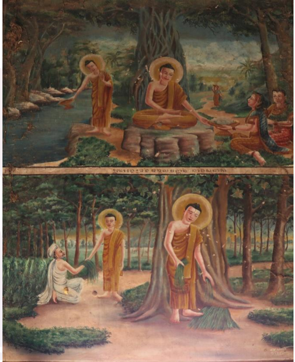
រូបលេខ៦ គំនូរព្រះវិហារវត្តកោះផ្កៅ (កំពត)