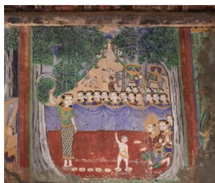
រូបលេខ៣ គំនូរនៅព្រះវិហារវត្ត អំពិល (បន្ទាយមានជ័យ)

ចំពោះសិល្បៈគំនូរក្នុងទិដ្ឋភាពព្រះអង្គទ្រង់ប្រសូត ដែលជាហេតុទី១ នៃបុណ្យ វិសាខបូជា តែងឃើញមានព្រះឥន្ទ្រ ព្រះព្រហ្ម និងទេពនិករផ្សេងៗយាងសាទរ។ សោតឯ ទិដ្ឋភាពមួយផ្នែកទៀត គំនូរវត្តខ្លះគេគូរព្រះភ័ក្រ្តអង្គក្សត្រដូចព្រះភ័ក្រ្តព្រះបាទបរមរតន កោដ្ឋក្នុងចំណោមមនុស្សម្នា និងបរិវាផងទាំងឡាយ ឬវត្តខ្លះគូរឧទ្យាននោះនៅខាងមុខ ប្រាសាទអង្គរ។