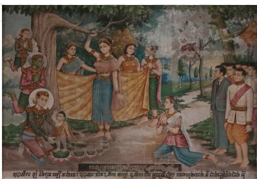
រូបលេខ៤ គំនូរនៅព្រះវិហារវត្តកណ្តាល (កំពង់ចាម)