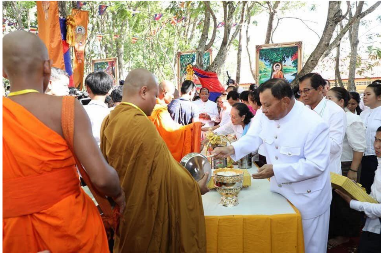
រូបលេខ២ សម្តេចវិបុលសេនាភក្តី សាយ ឈុំ អញ្ជើញជាអធិបតីភាពដ៏ខ្ពង់ខ្ពស់ក្នុងពិធីបុណ្យពិសាខបូជានៅបរិវេណព្រះមហាសក្យមុនីចេតិយភ្នំព្រះរាជទ្រព្យ ឆ្នាំ២០១៩

បានព្រះសក្យមុនីចេតិយថ្មីលើភ្នំព្រះរាជទ្រព្យ តែងមានការនិមន្តចូលរួមពីព្រះសង្ឃគ្រប់ជាន់ថ្នាក់ និងមានការអញ្ជើញចូលរួមពីថ្នាក់ដឹកនាំជាតិ និងមន្ត្រីរាជការ ប្រារព្ធបុណ្យវិសាខបូជាយ៉ាងអធិកអធមក្រៃលែង (រូបលេខ២)។ ដោយឡែកនៅតាមបណ្តាវត្តអារាមនានាទូទាំងប្រទេស ក៏តែបានរៀបចំពិធីបុណ្យវិសាខបូជាព្រមទាំង ស្របតាមរដ្ឋធម្មនុញ្ញនៃព្រះរាជាណាចក្រកម្ពុជា ដែលបានចែងថាព្រះពុទ្ធសាសនាជាសាសនារបស់រដ្ឋ។