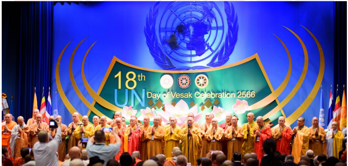
រូបលេខ១ វិសាខបូជាប្រារព្ធធ្វើនៅទីស្នាក់ការកណ្តាលអង្គការសហប្រជាជាតិ

វិសាខបូជា គឺជាបុណ្យមួយដ៏សំខាន់បំផុត ដែលប្រទេសអ្នកកាន់ព្រះពុទ្ធសាសនា និងពុទ្ធបរិស័ទទូទាំងពិភពលោក ក៏ដូចជាកម្ពុជាតែងប្រារព្ធធ្វើជារៀងរាល់ឆ្នាំ ដើម្បីរំលឹក នឹកដល់អភិលក្ខិតសម័យទាំងបី គឺថ្ងៃព្រះពុទ្ធទ្រង់ប្រសូត ត្រាស់ដឹង និងបរិនិព្វាន នាថ្ងៃ ១៥កើត ពេញបូណ៌មី ក្នុងខែពិសាខ។ ទន្ទឹមនឹងនេះ បុណ្យវិសាខបូជាត្រូវបានអង្គការ សហប្រជាជាតិប្រកាសទទួលស្គាល់នៅថ្ងៃទី១៥ ខែធ្នូ ឆ្នាំ១៩៩៩ ហើយបានប្រារព្ធធ្វើនៅ ការិយាល័យអង្គការសហប្រជាជាតិជារៀងរាល់ឆ្នាំ (រូបលេខ១)។ 1 ក្នុងប្រទេសកម្ពុជា វិសាខបូជាត្រូវបានរាជរដ្ឋាភិបាល កំណត់ជាថ្ងៃបុណ្យជាតិប្រចាំឆ្នាំ នៅក្នុងប្រតិទិនឈប់ សម្រាកការងាររបស់មន្ត្រីរាជការ និយោជិត និងកម្មករ។