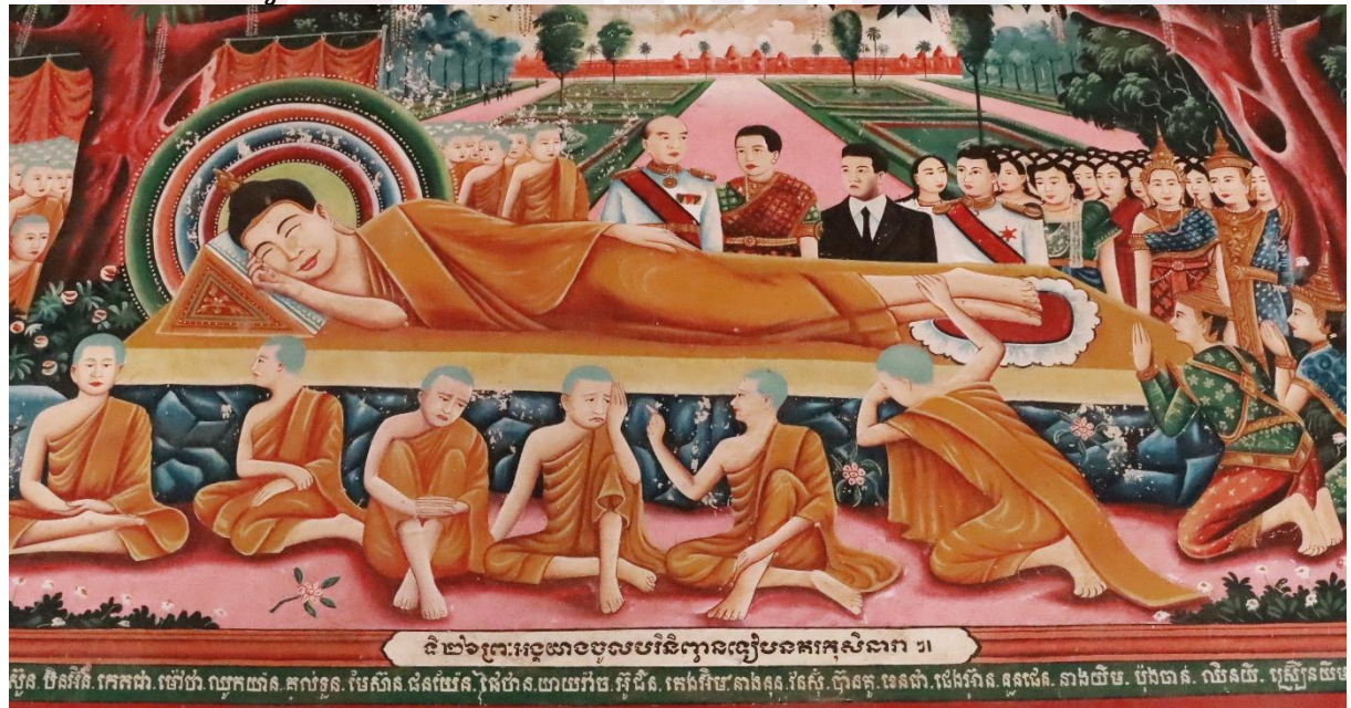
រូបលេខ៨ គំនូរព្រះវិហារវត្តពុទ្ធា (ត្បូងឃ្មុំ)

ក្នុងពុទ្ធប្រវត្តិរៀបរាប់ថា ពួកមល្យក្សត្រនិងអ្នកក្រុងកុសិនារា កើតទុក្ខយំសោក បោកខ្លួនស្តាយព្រះពុទ្ធអង្គជាពន់ពេកមកថ្វាយបង្គំព្រះសាស្តាក្នុងវេលាចុងក្រោយយ៉ាង ច្រើនកុះករ។ ទិដ្ឋភាពត្រង់នេះ នៅតាមព្រះវិហារសម័យសង្គមរាស្ត្រនិយមខ្លះគេច្រើនគូរ បញ្ចូលព្រះវត្តមានព្រះធាយាលក្ខណ៍ព្រះមហាក្សត្រខ្មែរ ៨ ជាពិសេសព្រះវត្តមាន ព្រះ បរមរតនកោដ្ឋ និងរាជបរិវារមួយអន្លើ ព្រមទាំងព្រះភិក្ខុសង្ឃមួយក្រុមគង់ខាងមុខសោក សៅស្តាយស្រណោះព្រះពុទ្ធអង្គ។ ប៉ុន្តែក្នុងចំណោមនោះមានព្រះភិក្ខុមួយព្រះអង្គគង់ សមាធិដោយស្ងៀមស្ងាត់។ ក្នុងគំនូរព្រះវិហារវត្តពុទ្ធា គេគូរទិដ្ឋភាពព្រះពុទ្ធបរិនិព្វាននៅ ឧទ្យាន មុខប្រាសាទអង្គវត្ត ហើយគូរព្រះធាយាលក្ខណ៍ ព្រះបាទ នរោត្តម សុទាម្រឹត និង ព្រះមហាក្សត្រីយានី ព្រមទាំង ព្រះបរមរតនកោដ្ឋ គង់នៅក្រោយព្រះសពព្រះ សម្មាសម្ពុទ្ធ។ ព្រះធាយាលក្ខណ៍ ព្រះបរមរតនកោដ្ឋ គេគូរជាពីរអង្គ ពោលគឺមួយបែប ទ្រង់អារព័ររៀបផ្ទុះការបែបអឺរ៉ុប និងមួយទៀតទ្រង់ព្រះភូសាកុតកពណ៌ស។