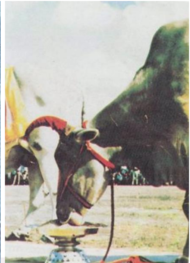
រូបលេខ៨-៩ ព្រះលក្ខណៈសម្គាល់ទូទៅ និងទម្រង់ស្នែងនៃគោឧសភរាជ ក្នុងទសវត្សរ៍ទី៥០