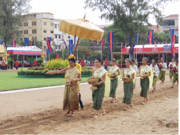
រូបលេខ៤-៥ ព្រះអង្គម្ចាស់ នរោត្តម ចក្រវុឌ្ឍ និងព្រះមហាក្សត្រីយ័ ស៊ីសុវត្ថិ ចាន់ស៊ីជា យាងជាស្តេចមាយ និងមេហ្វូ ក្នុងព្រះរាជពិធីច្រត់ព្រះនង្គ័លប្រារព្ធនៅទីព្រះស្រែវាលព្រះមេរុ រាជធានីភ្នំពេញ ឆ្នាំ២០១២