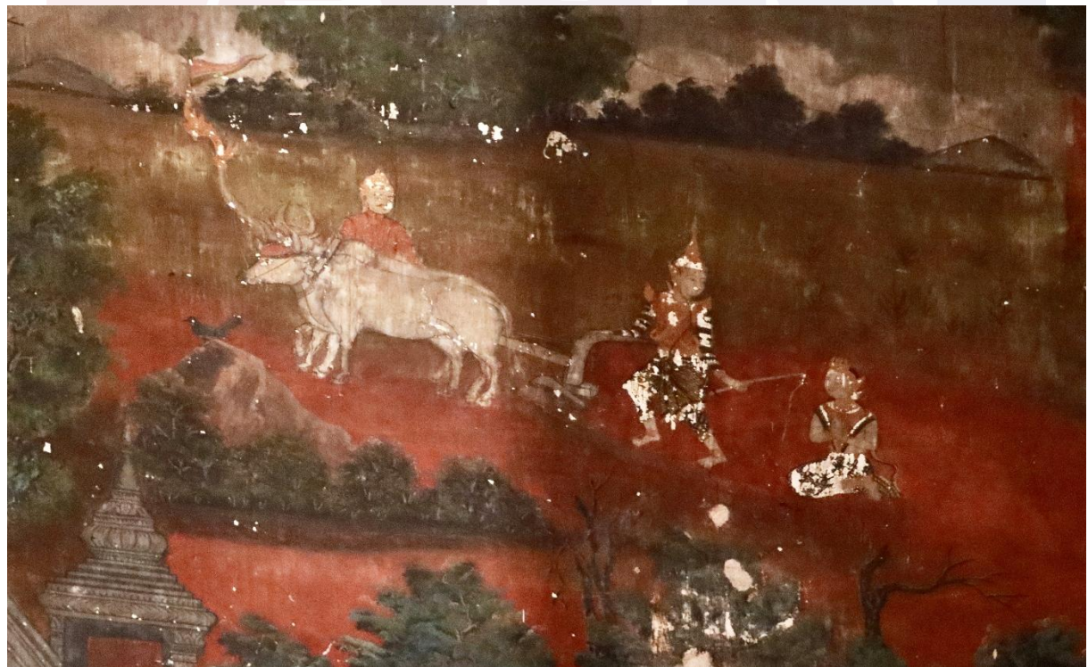
រូបលេខ៦ ព្រះបាទសុទ្ធាទន៍យាងច្រត់ព្រះនង្គ័ល (គំនូរវត្តកំពង់ត្រឡាចលើ)

ដោយឡែកបើត្រូវឡប់មកនិយាយអំពីព្រះគោឬគោឧសភរាជ ជាព្រះពាហនៈរបស់ព្រះមហាក្សត្រ មានព្រះលក្ខណៈល្អបំផុត ពោលគឺជាស្តេចគោឈ្មោះ “ឧសភ” មានកម្លាំងលើសលុបគោសាមញ្ញ អាចអូសរទេះចំនួន៥០០ ផុកពេញដោយរបស់ទ្រព្យ។ គោឧសភរាជនេះ កើតមានក្នុងលោកតែមួយដងមួយកាល ហើយមានតែក្នុងទីខ្លះ មិនមានទូទៅគ្រប់ស្រុកគ្រប់ប្រទេសឡើយ។ តាមជំនឿបុរាណលោកជឿថា គោឧសភរាជ ជាព្រះទីនាំងនៃព្រះឥសូរ ហើយជាព្រះគោដែលមានសម្បុរសផង។ 4 ប្រហែលគំនិតដូច្នោះហើយទើបគេសង្កេតឃើញគំនូរតាមវត្តខ្លះ ដែលគូរត្រង់អន្លើព្រះបាទសុទ្ធាទន៍ជាស្តេចផែនដីទ្រង់យាងចេញច្រត់ព្រះនង្គ័ល ក៏ឃើញគូរព្រះគោនោះមានសម្បុរស (រូបលេខ៦)។ ព្រះគោសម្បុរសដូច្នោះ ក៏ធ្លាប់ឃើញក្នុងរាជ្យព្រះករុណាព្រះបាទ នរោត្តម សីហនុ ព្រះបរមរតនកោដ្ឋ កាលទ្រង់ចេញច្រត់ព្រះនង្គ័លផ្ទាល់ព្រះអង្គដែរ (រូបលេខ៧)។ ប៉ុន្តែចំណោរតមកគោឧសភរាជក្នុងព្រះរាជពិធីច្រត់ព្រះនង្គ័លតែងសង្កេតឃើញសម្បុរខ្មៅដល់សព្វថ្ងៃ។