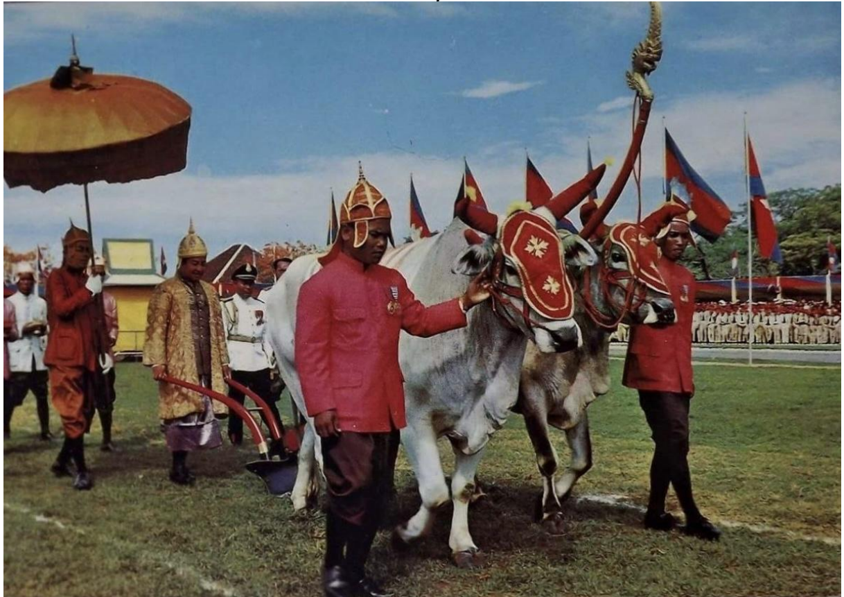
រូបលេខ៧ ព្រះករុណាព្រះបរមរតនកោដ្ឋទ្រង់យាងច្រត់ព្រះនង្គ័ល

ក្នុងទំនៀមព្រះរាជពិធីច្រត់ព្រះនង្គ័ល គេឃើញលក្ខណៈសម្គាល់ផ្សេងទៀតរបស់គោឧសភរាជមានដូចជា សម្បុរខ្មៅ ស្មែងរាងជ្រពាស់ឈ្នក់ ឬប្រក់នាគ គឺស្មែងកោងខុបទៅមុខបន្តិច ហើយវាត់ចុងឡើងបន្តិច។ ប៉ុន្តែគោពីរនីមួយៗផ្សេងទៀត សម្រាប់ហែមុខហែក្រោយក្នុងពេលកូរច្រត់ព្រះនង្គ័លនោះ ពុំឃើញមានកំណត់លក្ខណៈអ្វីឡើយ តើបើតាមធ្លាប់សង្កេតមកច្រើនតែមានសម្បុរក្រហម។ រីឯព្រះគោនោះ វេលាទើមច្រត់ព្រះនង្គ័លគេតុបតែងប្រដាប់ដោយគ្រឿងពាក់ស្រោមមុខ ស្រោមស្មែង និងពាក់សំពត់កម្រាលក្រហមលើខ្នង (រូបលេខ៨)។ ចំណែកនង្គ័លទាំង៣នោះ គេលាបពណ៌ខ្មៅ កាត់ខ្សែក្រហមដោយអន្លើ។ តែចន្ទោលគឺធ្វើជារូបនាគ លាបពណ៌លឿង (ពណ៌មាស) នៅត្រង់កនាគមានកូធ្វើពីរោមសត្វ។ 5