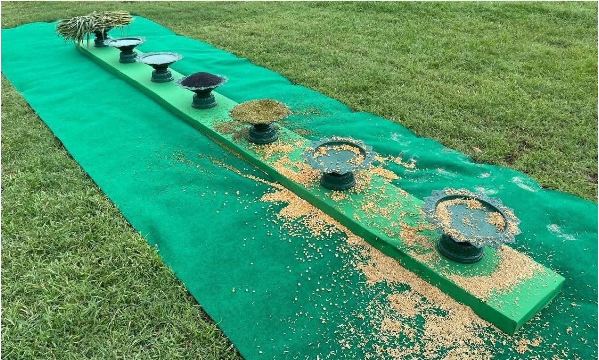
រូបលេខ១២-១៤ ពិធីផ្សងគោឧសភរាជចំពោះអាហារទាំង៧មុខ