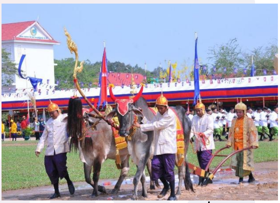
រូបលេខ២ រូបថតឯកសារព្រះរាជពិធីច្រត់ព្រះនង្គ័លនៅវាលព្រះមេរុ មុខសារមន្ទីរជាតិ (ប្រកព៖ ?)