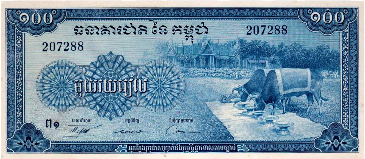
រូបលេខ១ ក្រដាសប្រាក់មួយរយរៀល បោះពុម្ពក្នុងឆ្នាំ១៩៥៦

នៅក្នុងសង្គមខ្មែរ ព្រះរាជពិធីច្រត់ព្រះនង្គ័ល បានកំណត់ជាពិធីបុណ្យជាតិ ដែលជានិមិត្តរូបនៃការចាប់ផ្តើមរដូវវស្សា និងការបង្កើនផលកសិកម្ម ក្រោមព្រះរាជវត្តមានដ៏ខ្ពង់ខ្ពស់បំផុតរបស់ព្រះមហាក្សត្រ ឬព្រះរាជតំណាង ជាអ្នកគួរស្រែ ដើម្បីឱ្យមានគន្លងមុនគេ ដ្បិតក្នុងជំនឿខ្មែរគោរពព្រះមហាក្សត្រជាស្តេចផែនដី គ្រប់គ្រងថែរក្សាព្រះនគរ។ ក្នុងព្រះរាជពិធីជាប្រពៃណីនេះ “ព្រះគោ” ឬ “គោឧសភរាជ” ជាពាហនៈបានដើរតួនាទីជាតួអង្គសំខាន់ ដែលមិនត្រឹមតែបង្ហាញពីកម្លាំងអូសទាញបង្កើនផលប៉ុណ្ណោះទេ តែថែមទាំងបានឱ្យយើងដឹងអំពីប្រវត្តិផលកសិកម្មដំណាំផ្សេងៗក្នុងរដូវដាំដុះថ្មី តាមរយៈការផ្សងអាហារពមុខ ដែលព្រះគោបរិភោគ។ ទិដ្ឋភាពជាអត្តសញ្ញាណវប្បធម៌ដ៏ថ្លៃថ្លានៃការផ្សងគោឧសភរាជ ក្នុងព្រះរាជពិធីច្រត់ព្រះនង្គ័លនេះ ក៏ធ្លាប់បោះពុម្ពនៅលើក្រដាសប្រាក់មួយរយរៀល ចរាចរប្រើប្រាស់នាចុងទសវត្សរ៍ទី៥០ ផងដែរ (រូបលេខ១)។