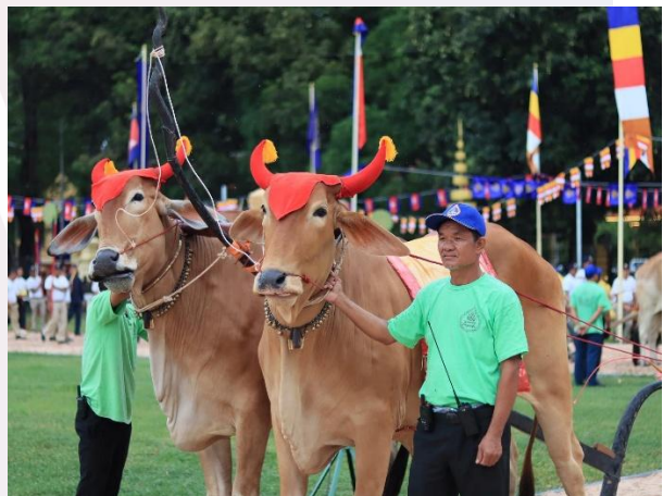
រូបលេខ១០-១១ ព្រះលក្ខណៈគោឧសភរាជសម័យបច្ចុប្បន្ន (សកម្មភាពសមនៅទីព្រះស្រែ)

ដូចពោលមកពីខាងដើម ក្រៅពីព្រះលក្ខណៈវិសេសនៃគោឧសភរាជដែលបុរាណ ចាត់ទុកថាប្រសើរលើសគោសាមញ្ញធម្មតា តួនាទីជានិមិត្តរូបមួយនៃគោឧសភរាជ គឺការ ផ្សព្វផ្សាយអំពីផលដំណាំដុះក្នុងរដូវខាងមុខ និងបញ្ហាសង្គមផ្សេងៗ។ ជាធម្មតាបុគ្គល ជាអ្នកដឹកនាំក្បួនប្រត់ព្រះនង្គ័ល ដែលមានស្តេចមេឃប្រត់ព្រះនង្គ័លកណ្តាល និងមេហ្វូ ដើរតាមក្រោយព្រះនង្គ័លទាំងបីប្រាចត្រាប់ពូជផ្សេងៗ តាមទិសទិសក្នុងណាត់ទ្វេ (ព័ទ្ធស្តាំ) ក្នុង បរិវេណព្រះស្រែ។ លុះប្រត់ព្រះនង្គ័លគ្រប់បីជុំហើយ គេលែងគោឧសភរាជឱ្យព្រាហ្មណ៍ ប្រោះព្រំ និងផ្សព្វផ្សាយអំពីផលដំណាំផ្សេងៗសម្រាប់រដូវកាលធ្វើកសិកម្មថ្មី។ វត្ថុដែលយកទៅ ផ្សព្វមានប្រាំពីរមុខគឺ ស្រូវ ពោត សណ្តែក ល្ង ស្មៅ ទឹក និងស្រា (រូបលេខ១២)។