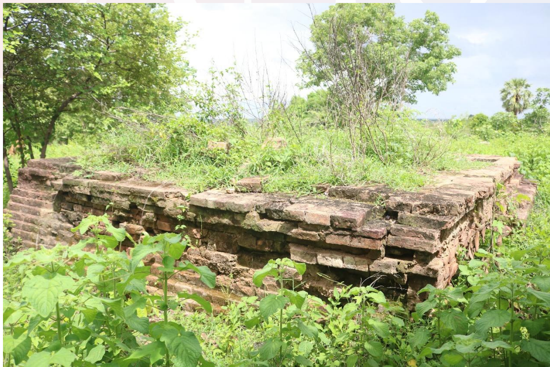
រូបលេខ២៖ ទិដ្ឋភាពប្រាសាទតូចបច្ចុប្បន្ន

អត្ថបទដោយ៖ កំ វណ្ណារ៉ា និងព្រះតេជគុណ អេង សុគង់