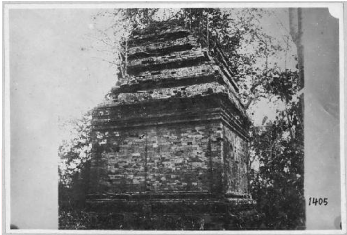
រូបលេខ១៖ ប្រាសាទតូច កាលនៅមានរូបរាង