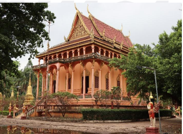
រូបលេខ២ រចនាសម្ព័ន្ធដំបូលព្រះវិហារវត្តពោធិហាន់ជ័យលើមើលពីចំហៀង