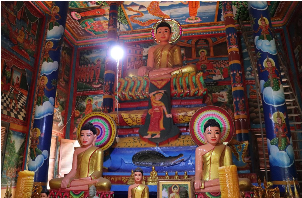
រូបលេខ៧ ព្រះពុទ្ធបដិមាធំតម្កល់ក្នុងព្រះវិហារវត្តពោធិហាន់ជ័យលើ

ដោយឡែកនៅផ្នែកខាងក្នុងព្រះវិហារ ជាលំហស្រឡះដែលចែកជាល្វែងគ្រឹះនៅចំកណ្តាលអមដោយរបៀងសងខាង ហើយសាងបល្ល័ង្កព្រះជីវ័នៅចុងល្វែងគ្រឹះម្ខាង តម្កល់ព្រះពុទ្ធបដិមាកាយវិហារផ្លាញ់មារ (រូបលេខ៧)។ នៅចំហៀងទាំងសងខាងនៃខឿន បល្ល័ង្កនោះ លោកគូរបង្ហាញទិដ្ឋភាពនរកក្នុងសភាពផ្សេងៗទៅតាមហេតុនៃទោស (រូបលេខ ១០-១១)។ ការគូរបង្ហាញអំពីទោសសត្វនរកលើបល្ល័ង្កបែបនេះ ក៏ឃើញនៅបណ្តាព្រះវិហារផ្សេងដូចជាព្រះវិហារចាស់វត្តរកាអារជាដើម។