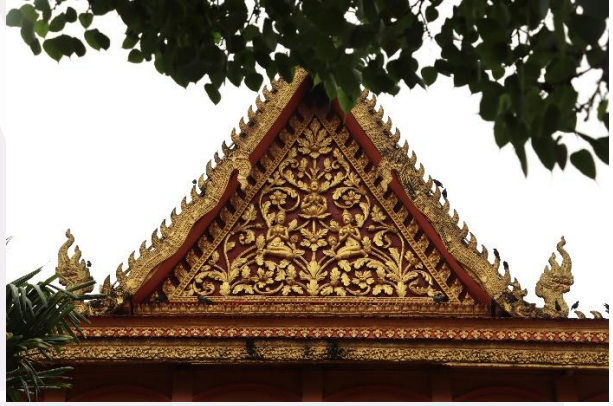
រូបលេខ៥ ហោជាងខាងក្រោយ

ចំណែកការលម្អផ្នែកខាងក្រៅព្រះវិហារ គេសង្កេតឃើញនៅតាមទ្វារ និងបង្អួច នីមួយៗលម្អដោយក្បាច់ពុម្ពស៊ីម៉ង់ត៍យ៉ាងរស់រវើកព័ទ្ធជុំវិញ។ ក្បាច់លម្អផ្នែកខាងលើទ្វារ និងបង្អួចទាំងអស់ រចនាជារាងស្ទើរពាក់កណ្តាលរង្វង់ ដែលមានទងក្បាច់រំលេចចេញពី ក្បាលខាប ដែលតែងឃើញនិយមប្រើក្នុងក្បាច់ភ្នំទេស។ 2 រីឯនៅតាមក្បាលសសរទ្រយ៉ ជុំវិញព្រះវិហារលម្អដោយទេនទយគ្រុឌ និងកិន្ទរ ហើយនៅតាមជើងជញ្ជាំងខឿនទី១ និងជញ្ជាំងខឿនទី២ មានលម្អដោយក្បាច់តាមថ្នាក់ដូចជា ពេជ្រមូល (តូច-ធំ) ឈូកផ្តាប និងលំហូតជាដើម (រូបលេខ៤-៦)។