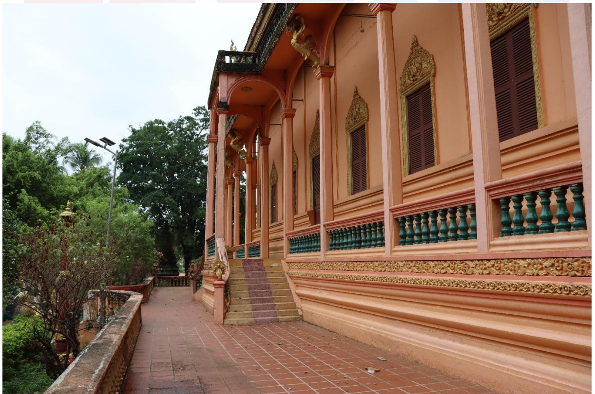
រូបលេខ៦-៨ រចនាសម្ព័ន្ធជុំវិញព្រះវិហារ និងការលម្អលើទ្វារ បង្អួច ក្បាលសសរ