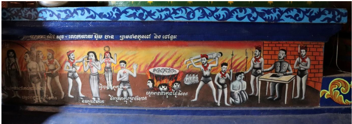
រូបលេខ១០ គំនូរបង្ហាញពីពពួកសត្វនរកលើខឿនបល្ល័ង្កព្រះជីវ័