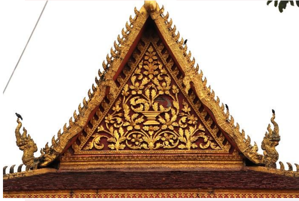
រូបលេខ៤ ហោជាងខាងមុខ

ចំពោះក្បាច់លម្អលើហោជាងទាំងពីរនៃព្រះវិហារនេះ គឺមានលក្ខណៈស្ទើរដូចគ្នា ពោលគឺជាទម្រង់ក្បាច់ភ្នំទេស លាបរំលេចពណ៌ទឹកមាសភ្លឺផ្ទេក លម្អលើផ្ទៃហោជាងទាំង មូល តែពុំមានចំណារចារឹកអ្វីជាសម្គាល់ឡើយ។ ហោជាងខាងមុខ(រូបលេខ៤) នៅត្រង់ ផ្នែកកណ្តាល គឺជារូបជើងពានទ្រគម្ពីរ ឬព្រះខ័ន(?) ព័ទ្ធជុំវិញដោយសន្លឹកក្បាច់យ៉ាងរស់ រវើក។ ហោជាងខាងក្រោយ(រូបលេខ៥) ក៏បង្ហាញពីភាពរស់រវើកនៃក្បាច់ភ្នំទេសពេញលើ ផ្ទៃហោជាងដែរ។ ប៉ុន្តែនៅផ្នែកកណ្តាលហោជាង មានរូបទេវតាចំនួន ៣អង្គ ស្ថិតក្នុង ឥរិយាបថប្រណមចេញពីសន្លឹកក្បាច់។ ទេពមួយអង្គខាងលើស្ថិតក្នុងឥរិយាបថបង្ហាញ ត្រឹមពាក់កណ្តាលខ្លួនចេញពីផ្កាយូក និងពាក់មុងស្រួច។ ចំណែកទេពពីរអង្គទៀតនៅ អមសងខាងនៃផ្នែកខាងក្រោម ក៏ស្ថិតក្នុងកាយវិការសំពះប្រណមបែររកគ្នា។