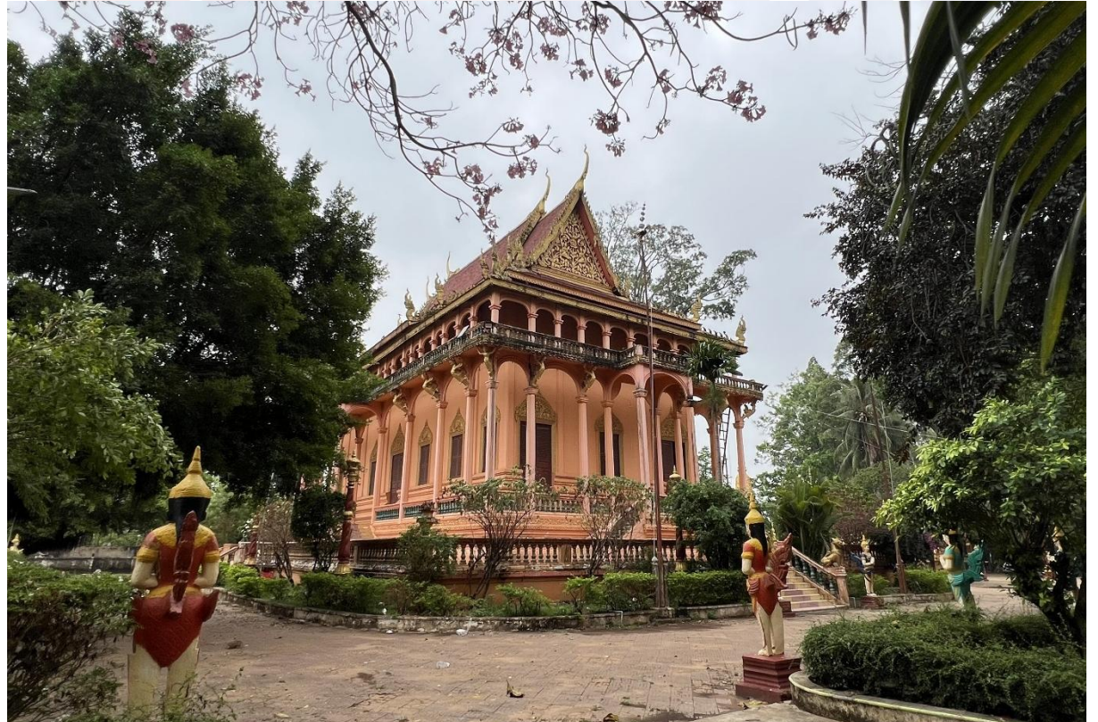
រូបលេខ១ ព្រះវិហារវត្តពោធិហាន់ជ័យលើមើលពីជ្រុងម្ខាង

វត្តពោធិហាន់ជ័យលើមិនត្រឹមតែជាទីសក្ការបូជាសម្រាប់ពុទ្ធសាសនិកប៉ុណ្ណោះទេ តែទីអារាមនេះគឺជាតីកតាងសិល្បៈស្ថាបត្យកម្មដ៏ល្អមួយ ស្ថិតនៅតាមបណ្តោយផ្លូវជាតិលេខ៧៣ ក្នុងឃុំហាន់ជ័យលើ ស្រុកឆ្នុង ខេត្តក្រចេះ។ វត្តនេះស្ថិតក្នុងភូមិសាស្ត្រយ៉ាងប្រពៃនៅប្របតាមដងទន្លេមេគង្គ ដូចបណ្តាវត្តបុរាណផ្សេងៗទៀតដែរ។ បើយោងតាមលទ្ធផលនៃការសិក្សារបស់អ្នកស្រាវជ្រាវ ព្រះវិហារវត្តពោធិហាន់ជ័យលើបានសាងឡើងនៅភាគខាងចុងសម័យអាណាព្យាបាលបារាំង។ អ្វីជាការកត់សម្គាល់នោះទោះបីជាពេលវេលាបានកន្លងផុតទៅរាប់សិបឆ្នាំ ឆ្លងកាត់សង្គ្រាម និងការផ្លាស់ប្តូររបបនយោបាយជាច្រើនដំណាក់កាល ក៏សំណង់ព្រះវិហារនេះនៅតែរក្សាបានរចនាសម្ព័ន្ធដើមយ៉ាងរឹងមាំ។ ភាពរឹងមាំនៃសំណង់ព្រះពុទ្ធសាសនានេះ សបញ្ជាក់ឱ្យឃើញពីបច្ចេកទេសសាងសង់ដោយផ្ចិតផ្ចង់ និងការជ្រើសរើសគ្រឿងបន្តិចសំណង់ប្រកបដោយគុណភាពខ្ពស់របស់បុព្វបុរសជំនាន់មុន បន្ទាល់សម្រាប់ការគោរពបូជាដល់សព្វថ្ងៃ (រូបលេខ១)។