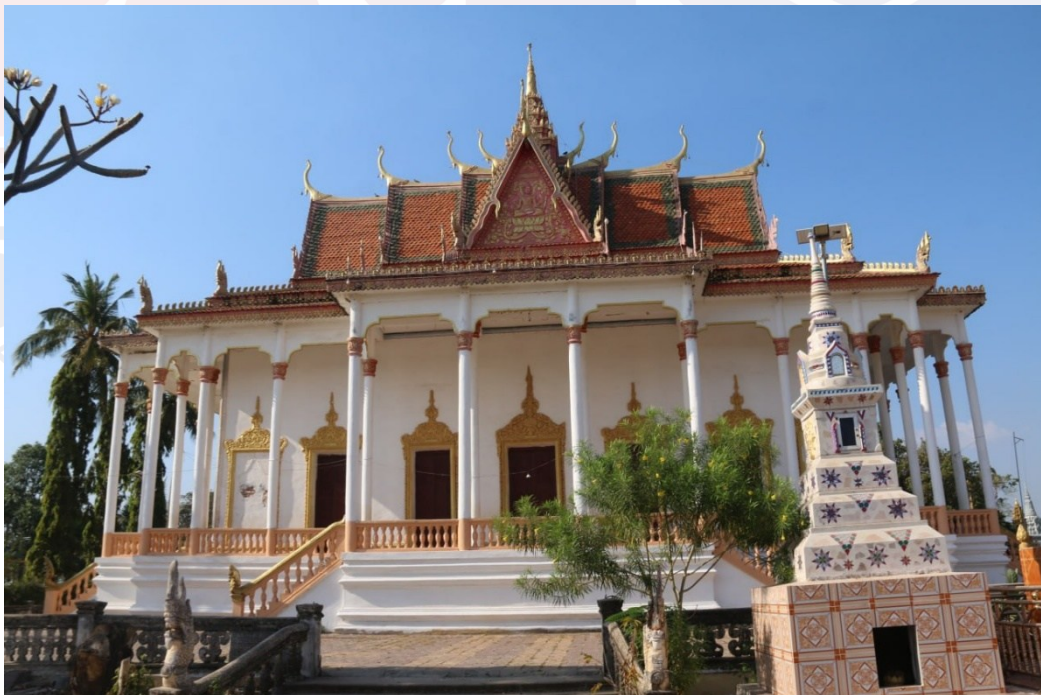
រូបលេខ២៖ ព្រះវិហារវត្តច្រណូក (ទីតាំងតម្កល់និងរក្សាទុកសិលាចារឹកទួលប្រាសាទបល្ល័ង្ក)