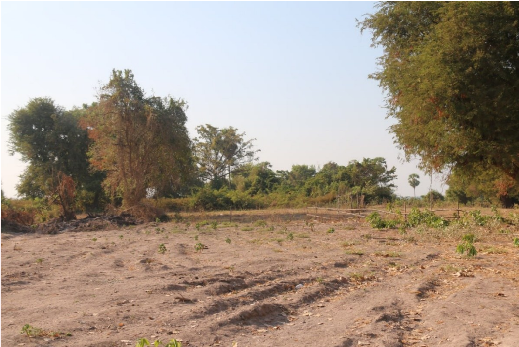
រូបលេខ១៖ ទិដ្ឋភាពទីតាំងទួលប្រាសាទបល្ល័ង្កសព្វថ្ងៃ (ទីតាំងរកឃើញសិលាចារឹក)