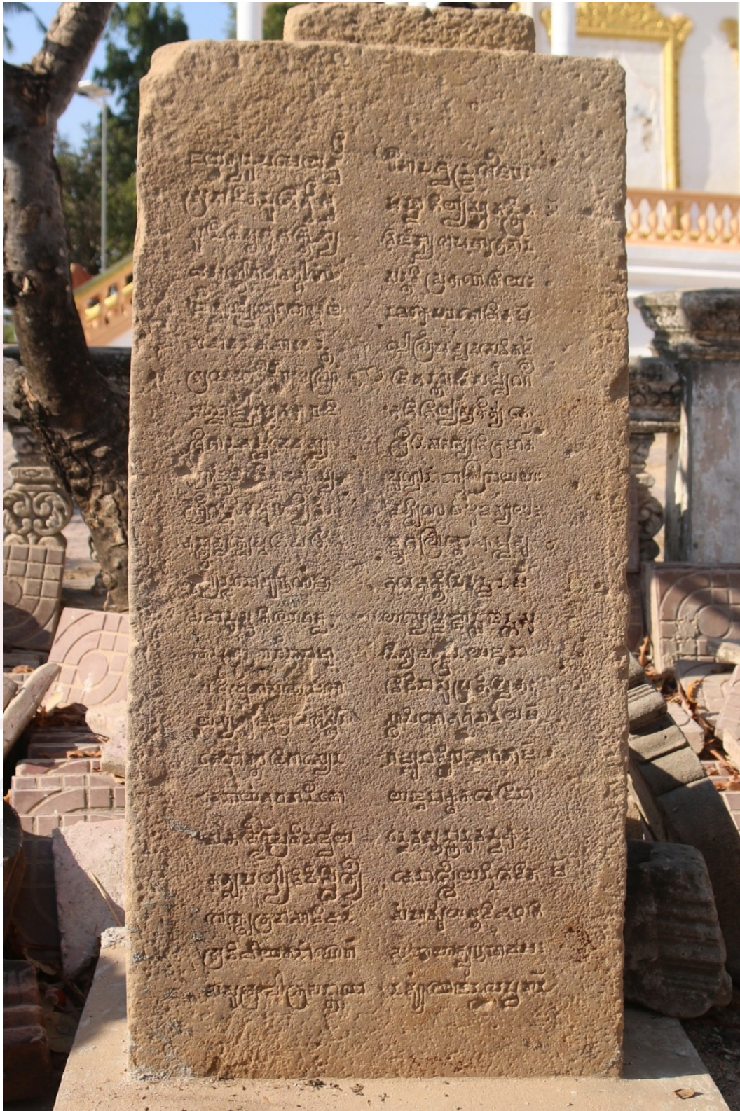
រូបលេខ៣៖ ស្ថានភាពបច្ចុប្បន្ននៃសិលាចារឹកទួលប្រាសាទបល្ល័ង្ក K.1418