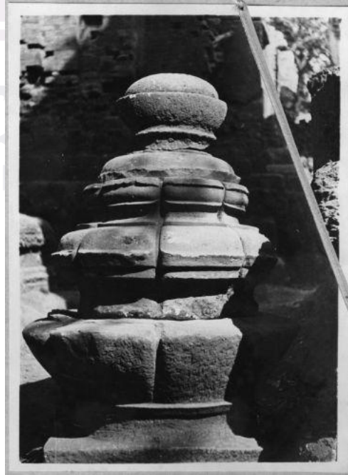
រូបលេខ៩-១០៖ ក្បាច់កំពូលប្រាសាទបាគួន និងប្រាសាទភ្នំជីសូរ ស.វ.ទី១១