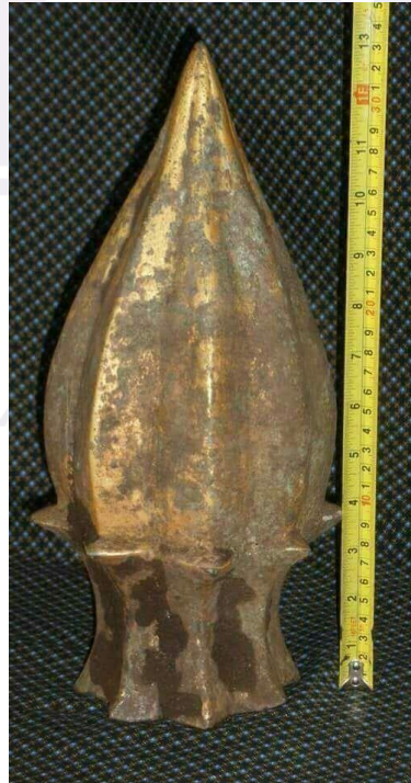
រូបលេខ១៧៖ ក្បាច់កំពូលរកឃើញនៅប្រាសាទបាយ័ន ស.វ.ទី១២ ឬ១៣