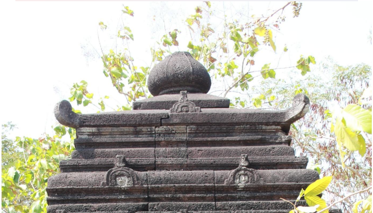
រូបលេខ២៖ ក្បាច់កំពូលជារាង "អាមលក" នៅប្រាសាទគុកព្រះធាតុ កំពង់ចាម ស.វ.ទី៧