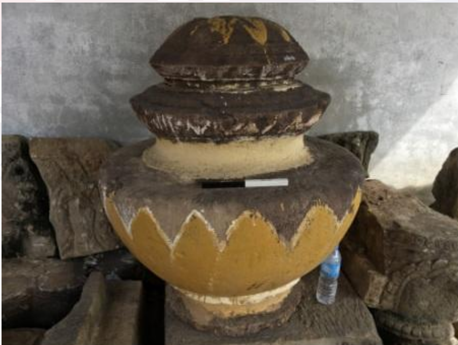
រូបលេខ១៤៖ ក្បាច់កំពូលរកឃើញនៅវត្តប្រាសាទទឹកជុំ ខេត្តឧត្តរមានជ័យ ស.វ.ទី១១