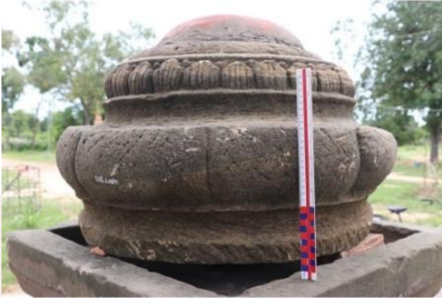
រូបលេខ១៣៖ ក្បាច់កំពូលរកឃើញនៅប្រាសាទបន្ទាយអំពិល ខេត្តបន្ទាយមានជ័យ ស.វ.ទី១១