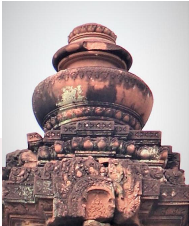
រូបលេខ៧៖ ក្បាច់កំពូលរកឃើញនៅប្រាសាទកំពង់ព្រះ កំពង់ឆ្នាំង ស.វ.ទី១០ រូបលេខ៨៖ ក្បាច់កំពូលប្រាសាទបន្ទាយស្រី ស.វ.ទី១០