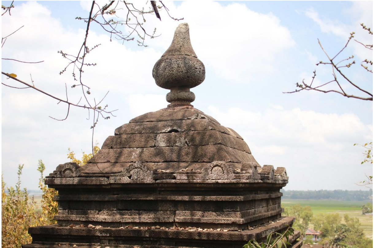
រូបលេខ១៖ ក្បាច់កំពូលជារាង "អាមលក" នៅប្រាសាទអាស្រមមហាបុស្សី តាកែវ ស.វ.ទី៧