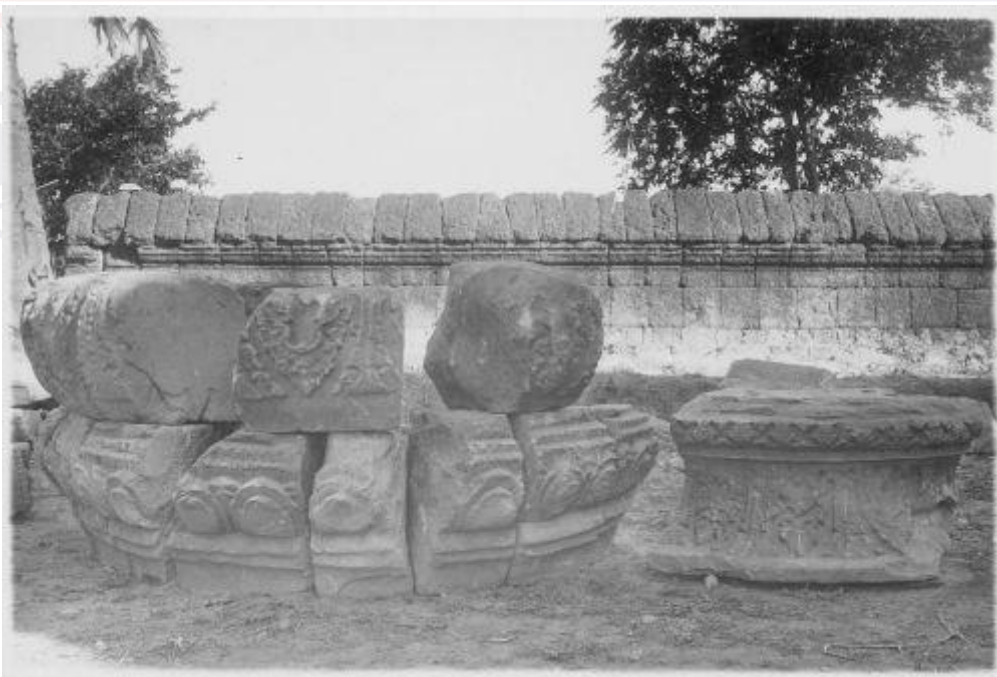
រូបលេខ៦៖ ក្បាច់កំពូលរកឃើញនៅប្រាសាទភ្នំក្រោម សៀមរាប ស.វ.ទី៧ (ប្រភព៖ EFEO)