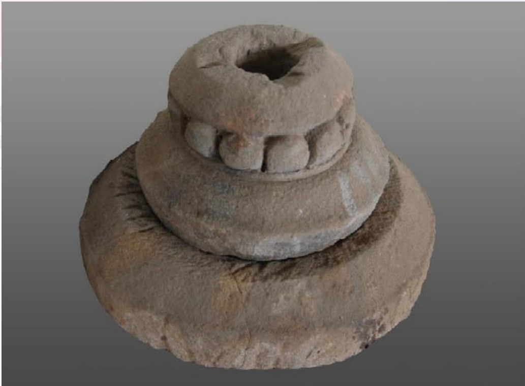
រូបលេខ១២៖ ក្បាច់កំពូលប្រាសាទស្រីគ្រប់លក្ខណ សំបូរព្រៃគុក ស.វ.ទី១១