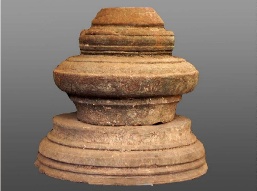
រូបលេខ១១៖ ក្បាច់កំពូលប្រាសាទស្រីគ្រប់លក្ខណ សំបូរព្រៃគុក ស.វ.ទី១១