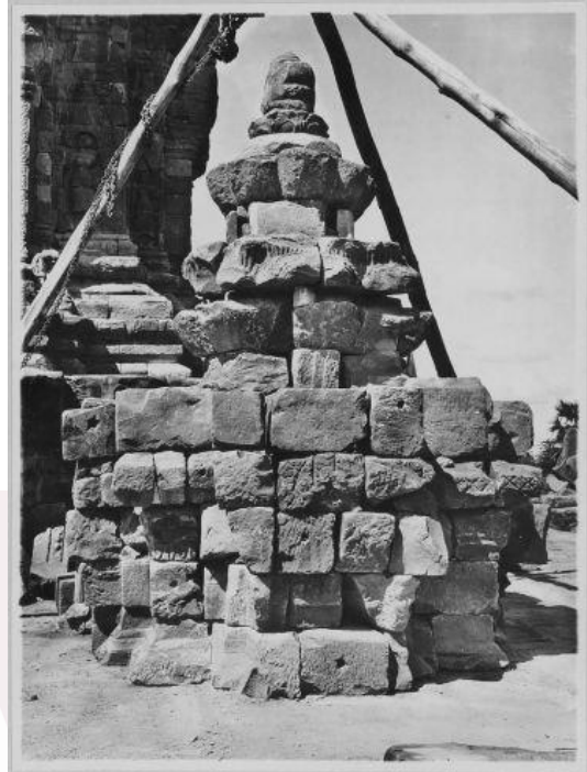
រូបលេខ១៥-១៦៖ ក្បាច់កំពូលប្រាសាទបន្ទាយសំរែ និងបាគង ស.វ.ទី១២