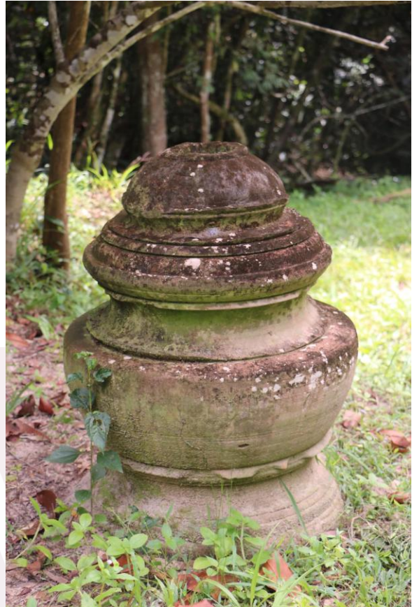
រូបលេខ៤៖ ក្បាច់កំពូលរកឃើញនៅប្រាសាទគុកព្រះធាតុ កំពង់ចាម ស.វ.ទី៧ រូបលេខ៥៖ ក្បាច់កំពូលប្រាសាទទ្រុងខ្នាញ់ ស.វ.ទី៧