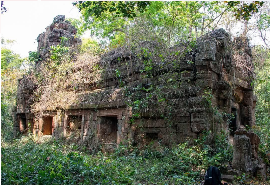
រូបលេខ៦៖ សាលាសំណាក់ ឬអគ្គិគ្គហ (ហោក្លើង) នៅប្រាសាទគោកមន (ខេត្តសៀមរាប)