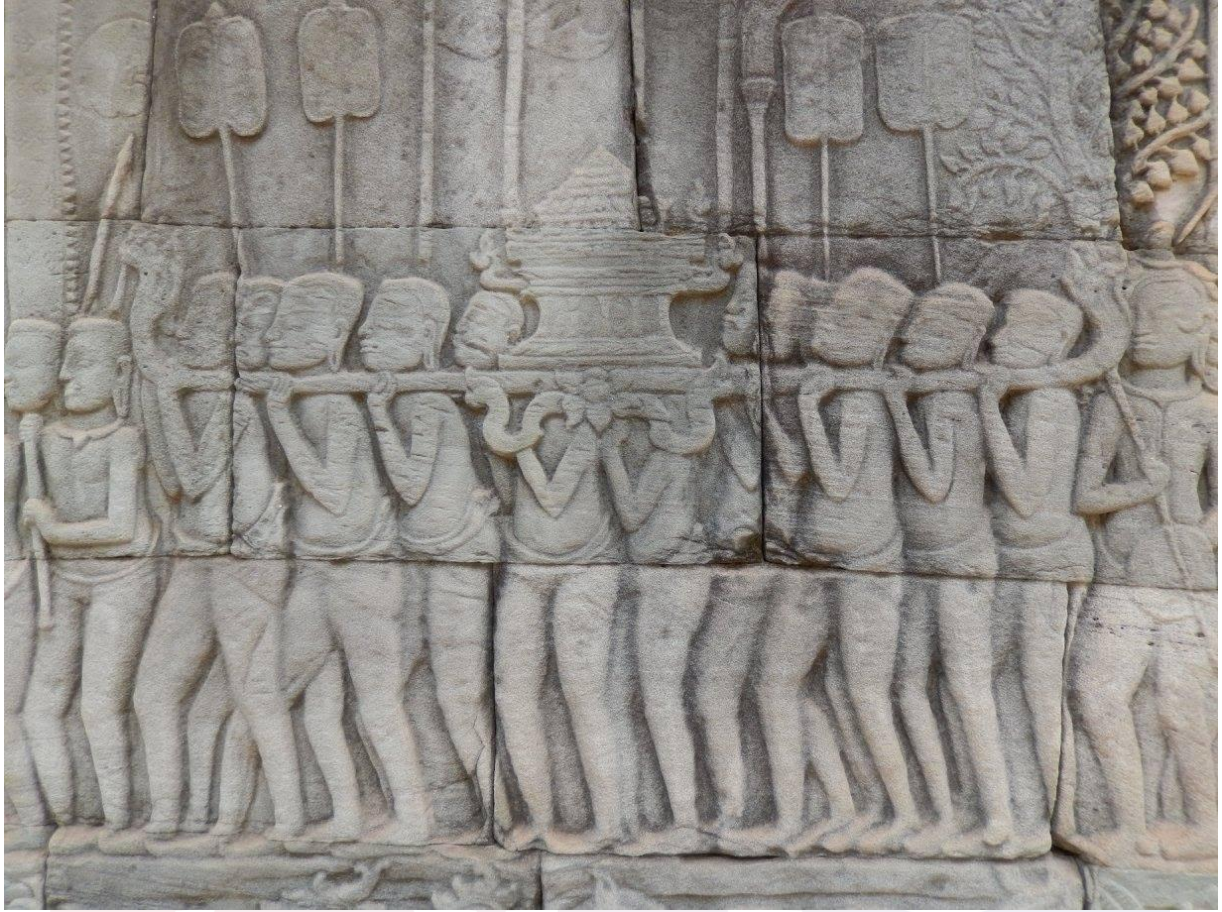
រូបលេខ១១១៖ ចម្លាក់ដង្ហែព្រះភ្លើងនៅជញ្ជាំងថែវប្រាសាទបាយ័ន