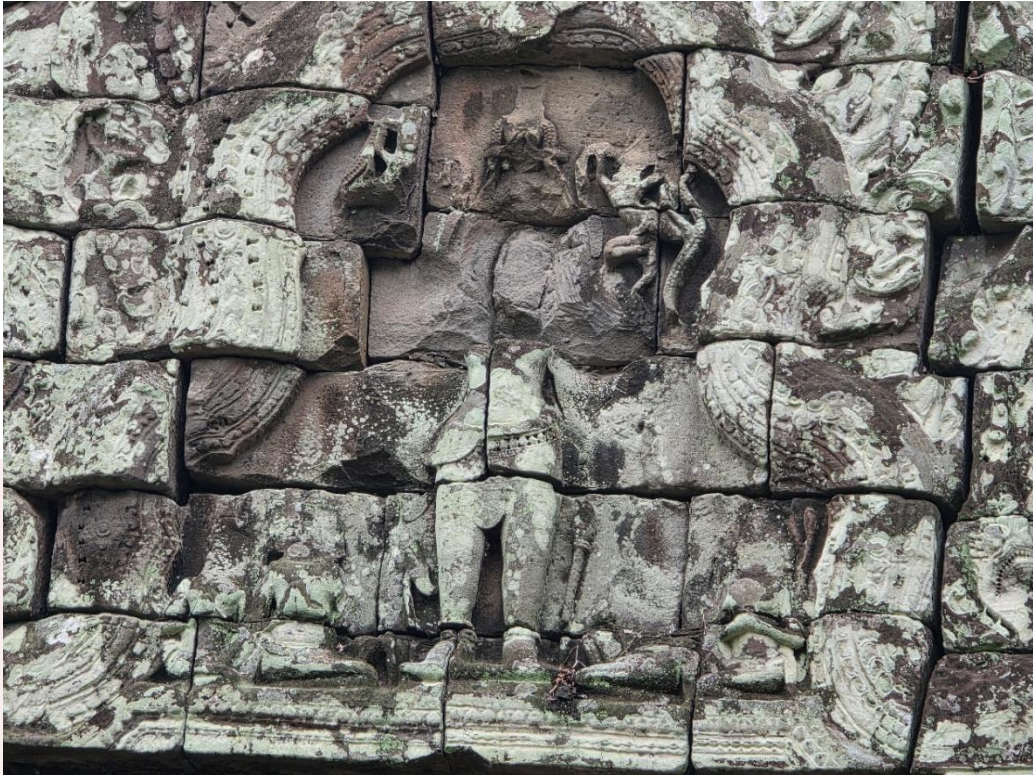
រូបលេខ៩៖ ចម្លាក់ព្រះលោកេស្វរនៅអគ្គិគូហ (ហោភ្លើង) នៅប្រាសាទបាគាណ (ព្រះខ័នកំពង់ស្វាយ)