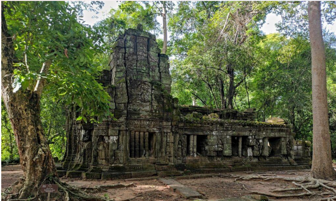
រូបលេខ២៖ ឧបកាយ៉ា ឬអគ្គិគូហ (ហោភ្លើង) នៅប្រាសាទតាព្រហ្ម