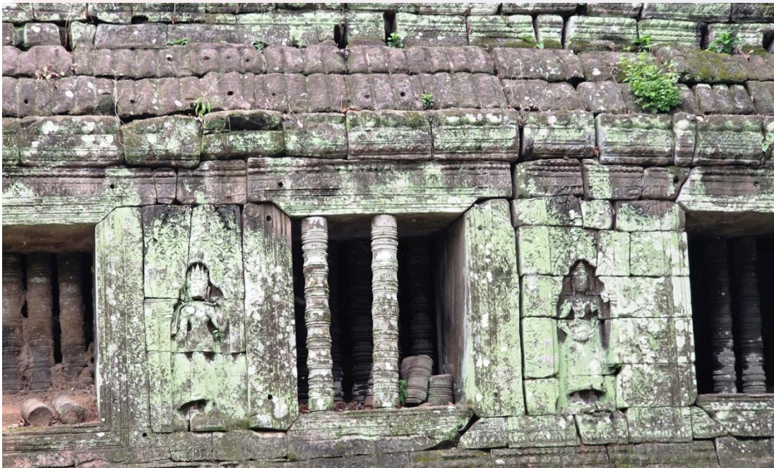
រូបលេខ៨៖ ចម្លាក់អប្សរានៅអគារអគ្គិគ្គហ (ហោក្លើង) នៅប្រាសាទបាកាណ (ព្រះខ័នកំពង់ស្វាយ)