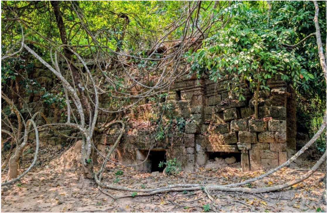
រូបលេខ៥៖ សាលាសំណាក់ ឬអគ្គិគ្គហ (ហោក្លើង) នៅប្រាសាទសំពៅ (ខេត្តសៀមរាប)