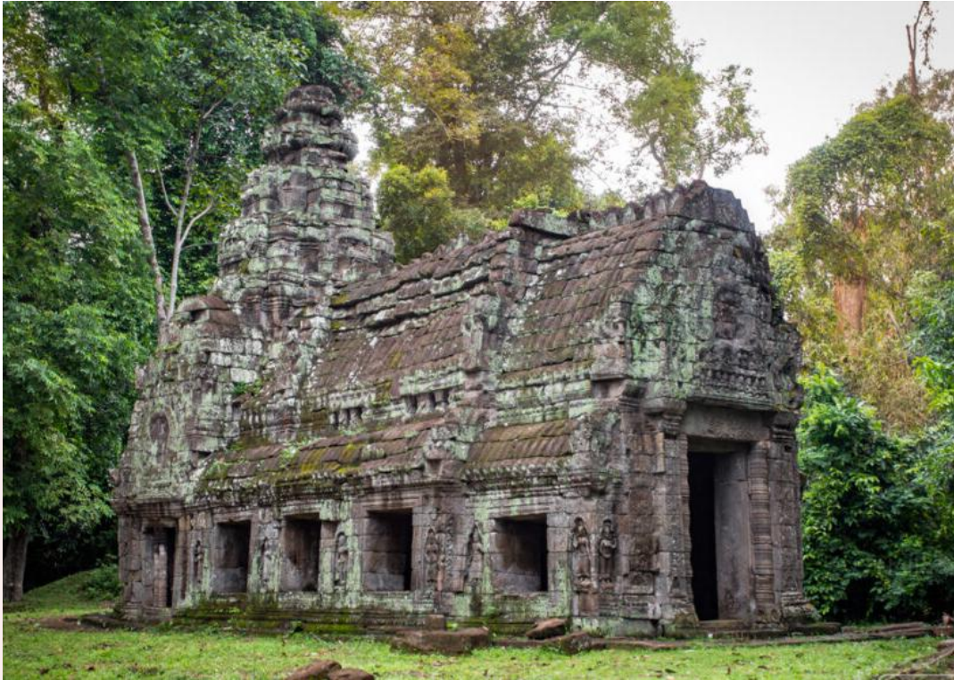
រូបលេខ១៖ ឧបកាយ៉ា ឬអគ្គិគូហ (ហោភ្លើង) ប្រាសាទព្រះខ័ន (ប្រភព៖ www.helloangkor.com )