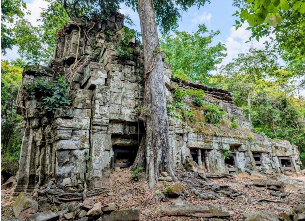
រូបលេខ៧៖ សាលាសំណាក់ ឬអគ្គិគ្គហ (ហោក្លើង) នៅប្រាសាទទ័ពជ័យតូច (ខេត្តសៀមរាប)