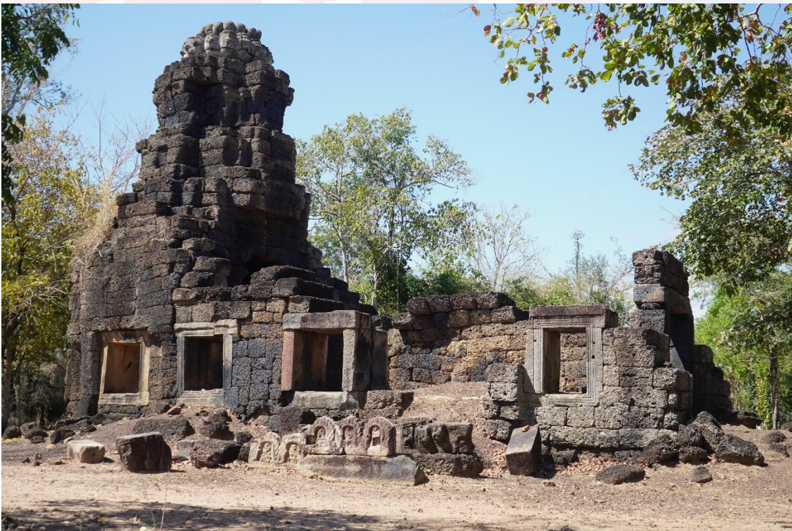
រូបលេខ៤៖ សាលាសំណាក់ ឬអគ្គិគ្លីហ (ហោភ្លើង) នៅប្រាសាទព្រហ្មកិល (ឧត្តរមានជ័យ)