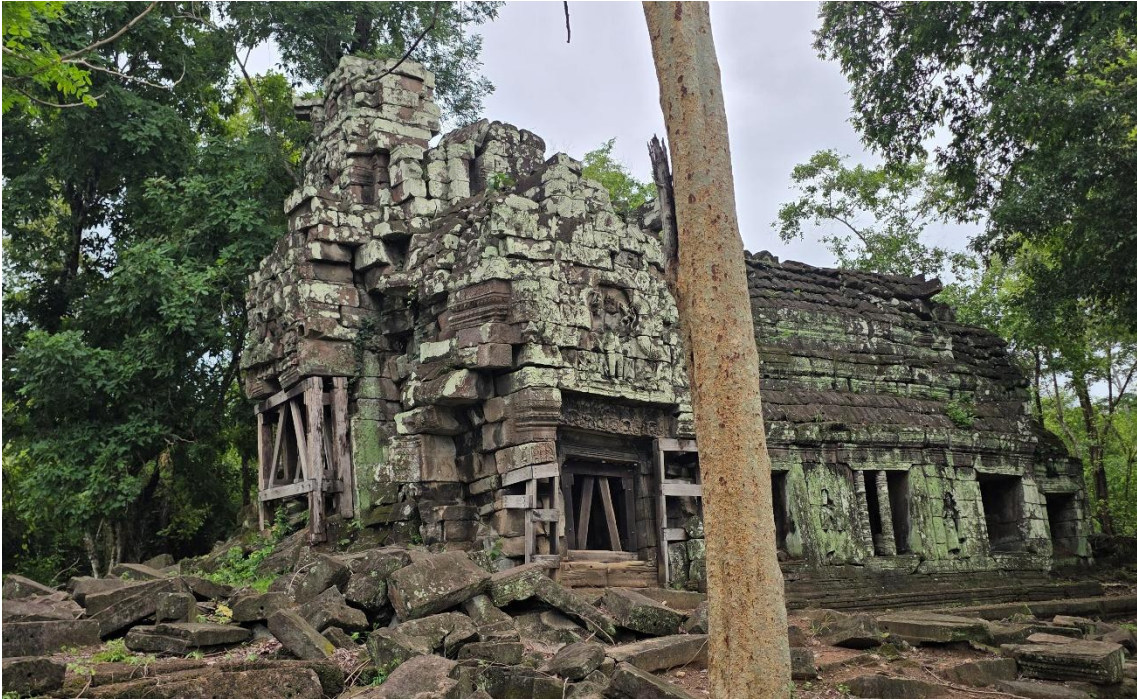
រូបលេខ៣៖ ឧបកាយ៉ា ឬអគ្គិគ្លីហ (ហោភ្លើង) នៅប្រាសាទបាគាណ (ព្រះខ័ន-កំពង់ស្វាយ)