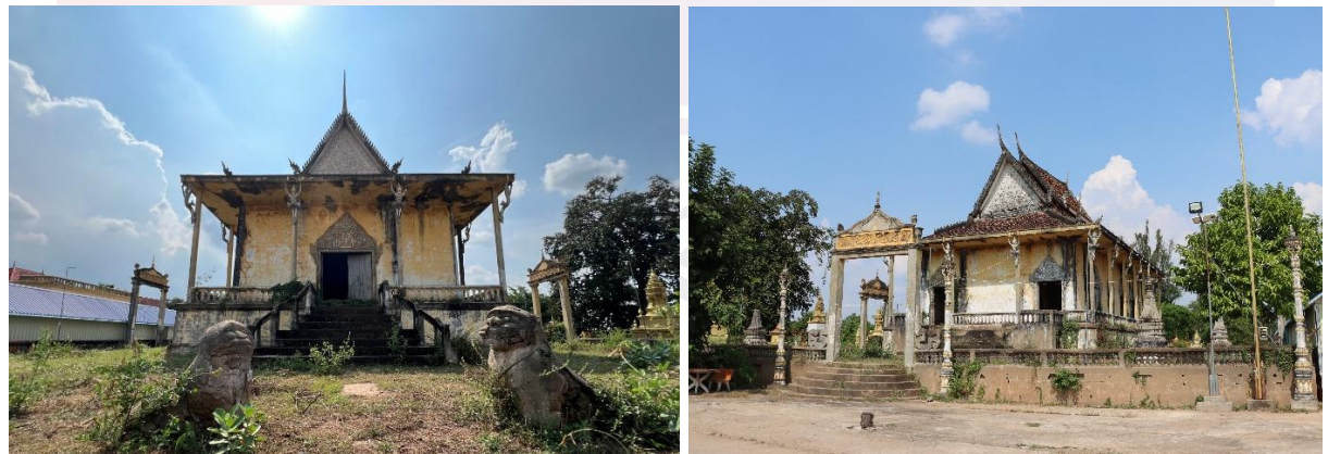
រូបលេខ១-២ ព្រះវិហារចាស់នៅវត្តភ្នំ (ផ្នែកមុខ និងផ្នែកខាងក្រោយ)

ស្ថិតនៅលើទឹកដីនៃឃុំកោះសួរទិន ស្រុកកោះសួរទិន ខេត្តកំពង់ចាម មានវត្តមួយ ឈ្មោះវត្តភ្នំ (ឬវត្តពោធិវិទ្ធិ) គឺជាវត្តដែលមានព្រះវិហារចាស់ថ្មីពីរសាងឡើងទន្ទឹមគ្នា នៅតាមបណ្តោយដងទន្លេមេគង្គ។ បច្ចុប្បន្នព្រះវិហារចាស់ក្នុងវត្តនេះពុំបានប្រើប្រាស់ធ្វើ កិច្ចប្រតិបត្តិគោរពបូជាដូចប្រមាណជាង២០ឆ្នាំមុនទៀតឡើយ ហើយគេសង្កេតឃើញថា ព្រះវិហារនេះកំពុងស្ថិតក្នុងសភាពទ្រុឌទ្រោម ពុកបាក់បែក ស្មៅព្រៃដុះរុំស្រោប និងធ្លុះ ធ្លាយដំបូលដោយអន្លើ(រូបលេខ១-២)។ ប៉ុន្តែបើពិនិត្យលក្ខណៈសិល្បៈស្ថាបត្យកម្ម ត្រៀម លម្អលើសំណង់ គំនូរពុទ្ធប្រវត្តិ និងចំណារកត់ត្រាផ្សេងៗ នាំឱ្យគេយល់ថាព្រះវិហារចាស់ ក្នុងវត្តភ្នំនេះសាងឡើងនៅពាក់កណ្តាលសតវត្សរ៍ទី២០ ហើយកន្លងមកព្រះសង្ឃ និង អ្នកស្រុកតែងនាំគ្នាជួសជុលថែទាំជាហូរហែ ជាពិសេសបានជួសជុលច្រើននៅក្នុងសម័យ សង្គមរាស្ត្រនិយម។ លុះដល់ឆ្នាំ២០០៨ វត្តភ្នំបានសាងព្រះវិហារថ្មីមួយទៀតសម្រាប់ ប្រើប្រាស់គោរពបូជាជំនួសព្រះវិហារចាស់ដែលតែងរងផលប៉ះពាល់ដោយគ្រោះធម្មជាតិ នៃការបាក់ប្រាំងទន្លេ។