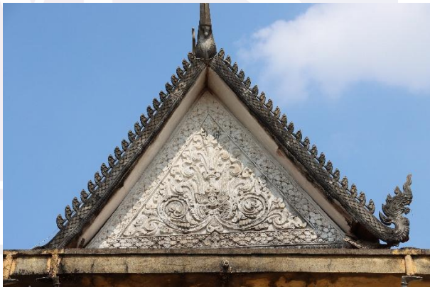
រូបលេខ៨-៩ ហោជាងខាងមុខ និងហោជាងខាងក្រោយនៃព្រះវិហារវត្តត្នោត