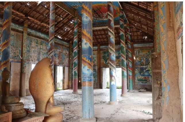
រូបលេខ១០-១១ ផ្នែកខាងក្នុងព្រះវិហារវត្តត្នោត