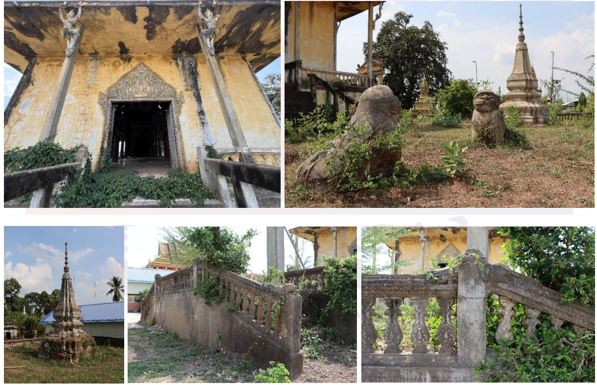
រូបលេខ៣-៧ រចនាសម្ព័ន្ធផ្សេងៗជុំវិញបរិវេណព្រះវិហារវត្តត្នោត

ចុងសម័យអាណាព្យាបាលបារាំង ដែលជាការចាប់ផ្តើមរួមបញ្ចូលគ្នារវាងទម្រង់សិល្បៈប្រពៃណីខ្មែរ និងឥទ្ធិពលសម្ភារៈសំណង់ថ្មីៗ។ នៅលើបរិវេណខៀនទី២ គេឃើញមានចេតិយបុរាណជាទម្រង់ចេតិយលាត សាងឡើងនៅតាមជ្រុងទាំង២ ចម្លាក់តោ១គូ ខាងមុខព្រះវិហារ និងមានខ្លោងទ្វារតាមទិសទាំង៤។ ចំណែកនៅតាមបង្គាន់ដៃជណ្តើរឡើងផ្នែកខាងមុខ មានធ្លាក់លម្អជារូបក្បាលជំរី និងភេប្នស្តារ(?) ដំរស់រវើកគួរឱ្យចាប់អារម្មណ៍ (រូបលេខ៣-៧)។ សូមបញ្ជាក់ថា នៅលើខៀនថ្នាក់ទី១ ខាងក្រោយព្រះវិហារ អមជណ្តើរផ្នែកខាងឆ្វេងមានចារ“ពុទ្ធសករាជ២៥០២” ហើយផ្នែកខាងស្តាំជណ្តើរចារ“គ្រិស្តសករាជ១៩៦១”។ កាលបរិច្ឆេទនេះ ទំនងបញ្ជាក់ពីការសាងបញ្ចប់ខៀនព្រះវិហារ ក្រោយសាងព្រះវិហារឡើងរយៈពេល១០ឆ្នាំ។