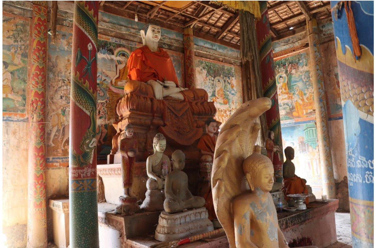
រូបលេខ១២ ព្រះបដិមាព្រះដីវត្តក្នុងព្រះវិហារចាស់វត្តត្នោត

ដោយឡែក ចំពោះព្រះដីវត្តម្តងក្នុងព្រះវិហារវត្តត្នោត គឺស្ថិតនៅខាងចុងនៃល្វែង គ្រឹះ។ ព្រះបដិមាតម្កល់លើបាល្ល័ង្កខ្ពស់ ដែលមានខ្លឹមបាល្ល័ង្ក២ថ្នាក់។ ផ្នែកតាមការ សិក្សាកាយវិការព្រះពុទ្ធបដិមា គេសម្គាល់ថា ជាកាយវិការព្រះពុទ្ធជាញ្ញាមារ ទ្រង់ដាក់ ព្រហស្តស្តាំដោយម្រាមទាំងប្រាំសណ្តូកស្របគ្នា ហើយលាតទៅប៉ះដី យកព្រះធរណីជា សាក្សី (រូបលេខ១២)។ 5