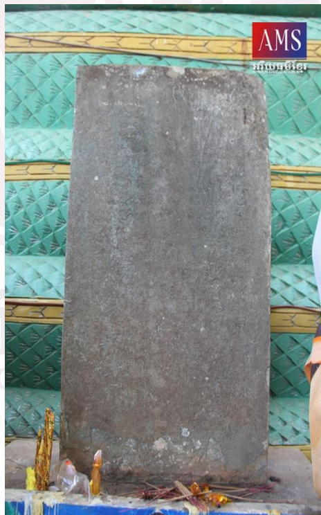
រូបលេខ២៖ មេធ្វារចារឹកប្រាសាទភ្នំបាវៀង