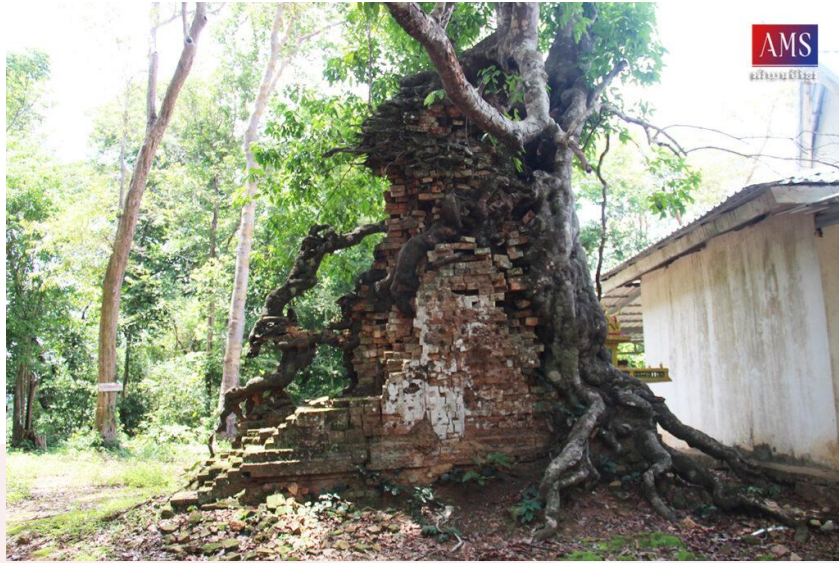
រូបលេខ១៖ ប្រាសាទភ្នំបាវៀង (ប្រភព៖ ម៉ង់ វ៉ាលី)